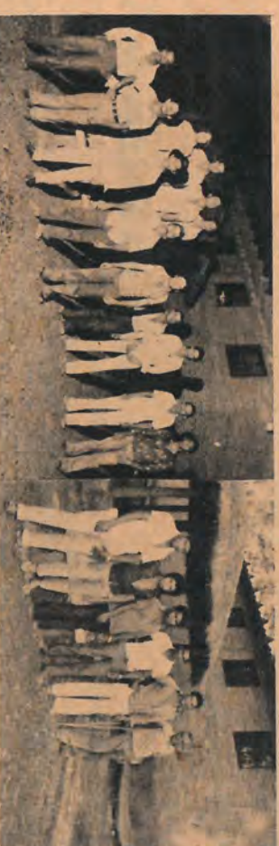
Pessoal que ocupa o alojamento.

dado e o que é mais importante, dentro das exigências legais, pois o FISCAL DE HIGIENE, DO CENTRO DE SAÚDE LOCAL, em sua recente visita, deu como