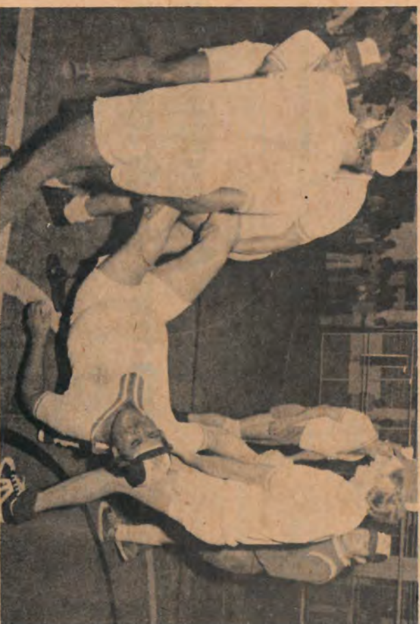
A última vez que Dondinho jogou bola, saiu da quadra assim.