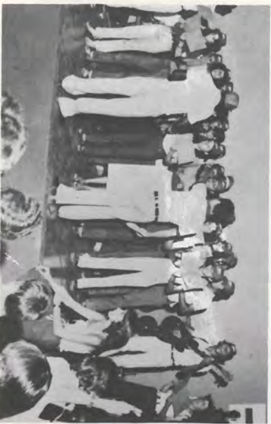
Coral da Equipe Vermelha foi Campeão cantando a música Luar do Sertão.