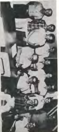
11 Diretoria Cipa/Carpa

O Observador cumprimenta a nova Diretoria da Cipa/Carpa, empossada no dia 28 de janeiro.