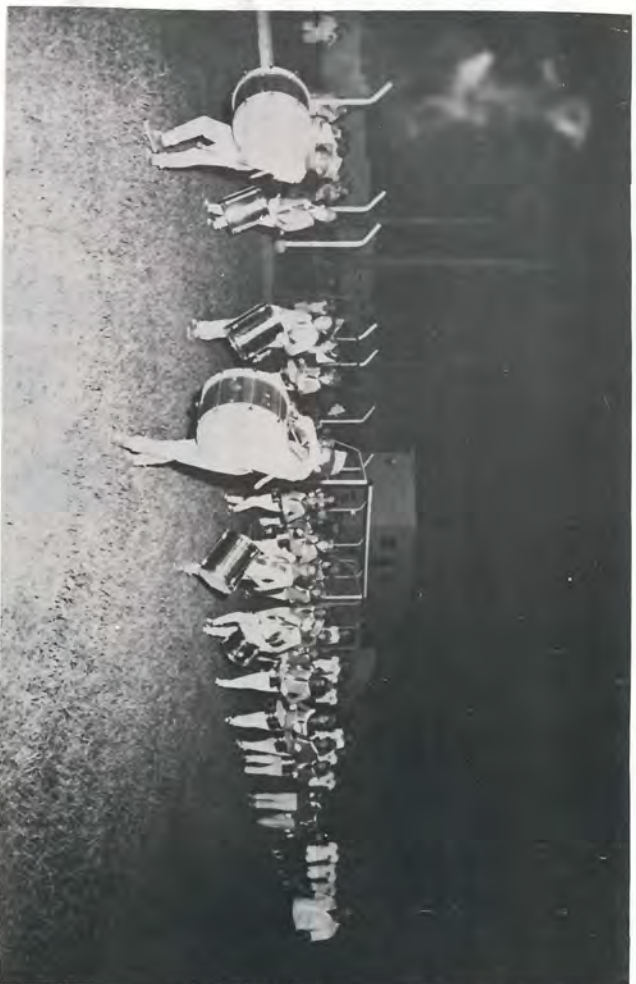
A Fanfarrinha Mirim entra garbosa no Estádio Irmãos Biagi.