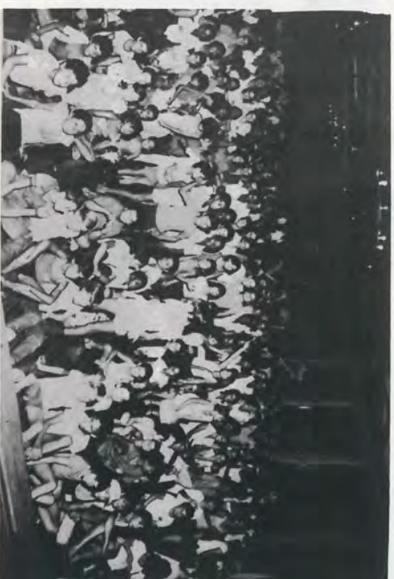
Um grande público concentrou-se no Clube Recreativo, na Noite da Música, dia 19.

No final da noite, o placar acusava 4 pontos para a equipe Vermelha e 1 para a Amarela.