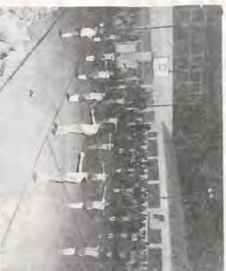
Na noite de 7 de julho, nossa sede recebeu um público que se constituiu, em sua maioria, por crianças, participantes