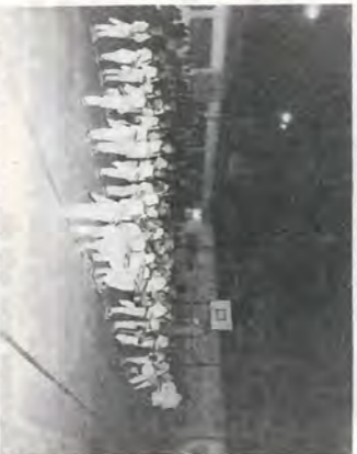
Nossa fanfarrinha-Mirim iniciou a solenidade de abertura dos Jogos Olímpicos