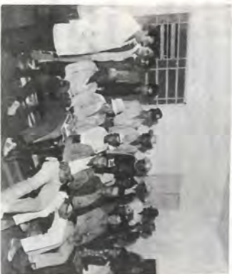
Tratoristas e Operadores que participaram do Curso.