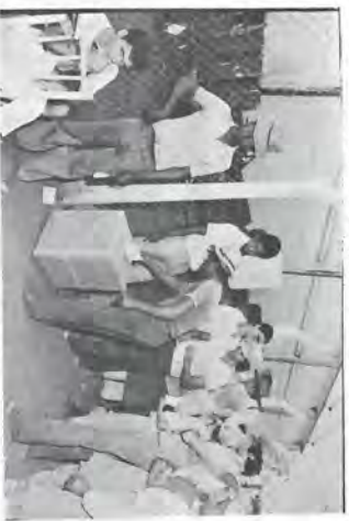
Aspectos da votação da Cipa/Carpa.

Realizou-se no dia 27 de novembro a votação para eleição dos elementos Representantes dos Empregados para a comissão da III Diretoria da Cipa/Carpa para o mandato de 82.