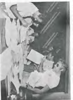
Flagrantes da apuração dos votos.

A eleição realizou-se sem transtornos, com muita ordem e disciplina. Foram colocadas 8 urnas nos diversos locais de trabalho, sendo possível, dessa forma, obter um número bastante representativo de empregados votantes, ou seja 1132. Apenas 268 empregados não votaram ou por estarem ausentes do serviço ou por se encontrarem em lugares de difícil acesso.