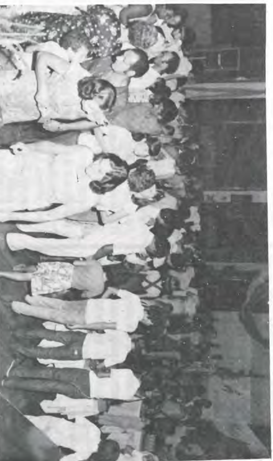
Todos queriam ver de perto os trabalhos.

"Esta é a X Exposição de Trabalhos. Há dez anos portanto, se vem realizando este tipo de trabalho. A gente pode notar pelos próprios trabalhos expostos que a qualidade deles tem evoluído. E a gente pode notar também pela alegria da criança e das mães que os fazem, que eles tem cumprido com a sua finalidade, isto é, de aproximar as pessoas, de fazer disso um veículo para se transmitir novidades para todos, de maneira tal que, mais uma vez, nós nos orgulhamos muito desse tipo de iniciativa. E, para comemorar o aniversário, temos a intenção de, no ano que vem fazer convites para outras pessoas de fora virem aqui na Exposição de Trabalhos para prestigiar ainda mais esse esforço de vocês.