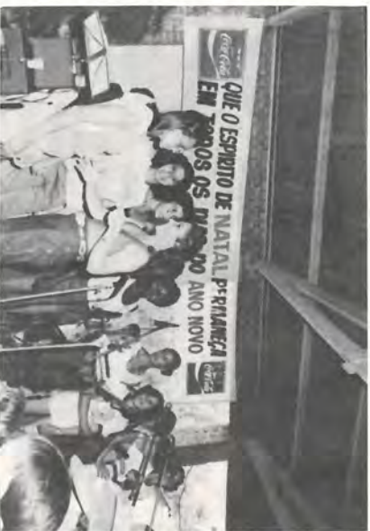
A Equipe Azul do Futebol feminino recebe as medalhas.