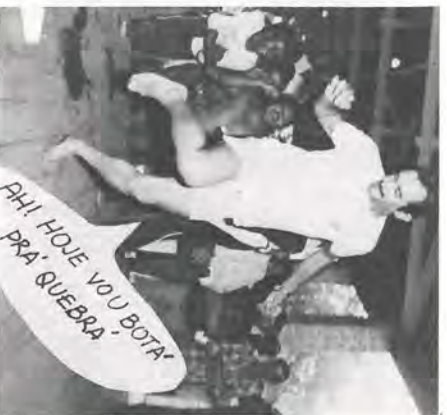
OH! HOJE VOU BOTA' PRA' QUEBRA