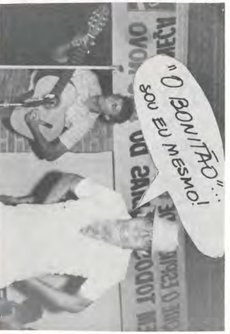
"O BONITÃO" SOU EU MESMO!