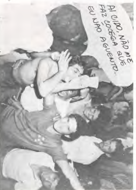
AI QUIDO, NÃO ME FAZ DOÇEÇA EU NMO PEVENTO