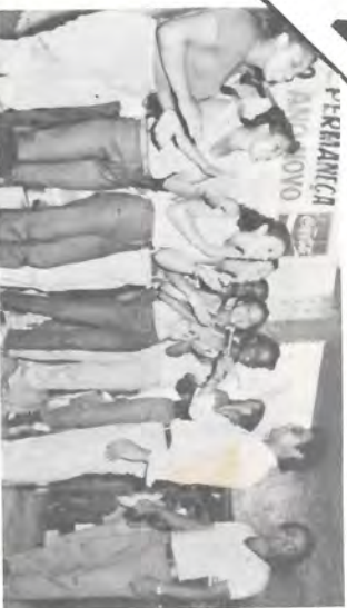
Essas garotas deram um show à parte.