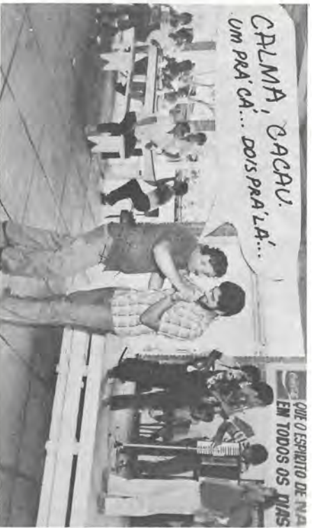
CALMA, CACA!... UM PRA' CÁ... DOIS PRA' LÁ...