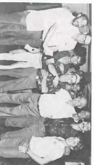
Binga feliz com seu belo presente.