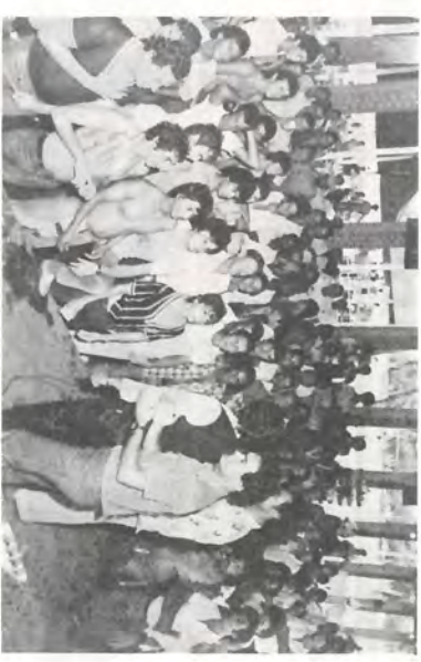
Abelardo também deu uma de repentista.