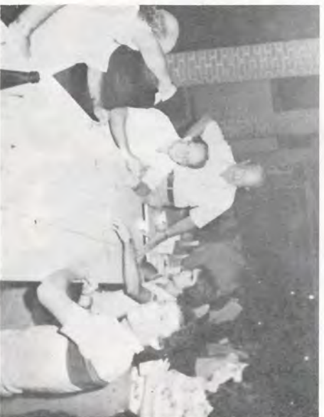
A prova do truco.