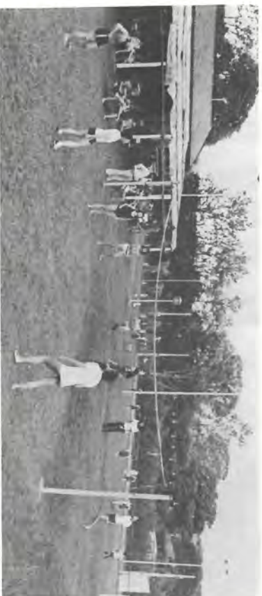
Aspectos da festa da Administração da Santa Maria, dia 19.

Houve jogo de volei e futebol, sendo vencedora a equipe da Fazenda. Para aqueles que gostam, não faltou o jogo de baralho e para aqueles aos quais a noite é criança, foi tudo muito bom mesmo, pois a reunião estendeu-se até as 4 da madrugada.