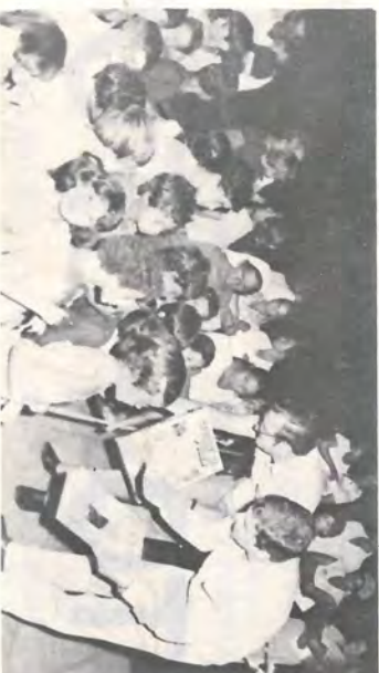
Natal Comunitário do pessoal da Fazenda Laranjeira, Santa Mariana e Fazendinha.