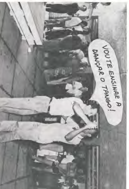
VOU TE ENSINAR A DANÇAR O TANGU!