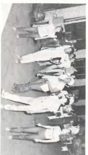
O jogo da peteca.