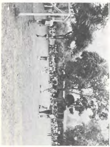
O futebol feminino foi uma das atrações da festa.