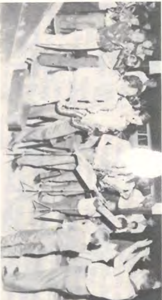
Banda Municipal de Serrana presente em todas as celebrações de Natal.