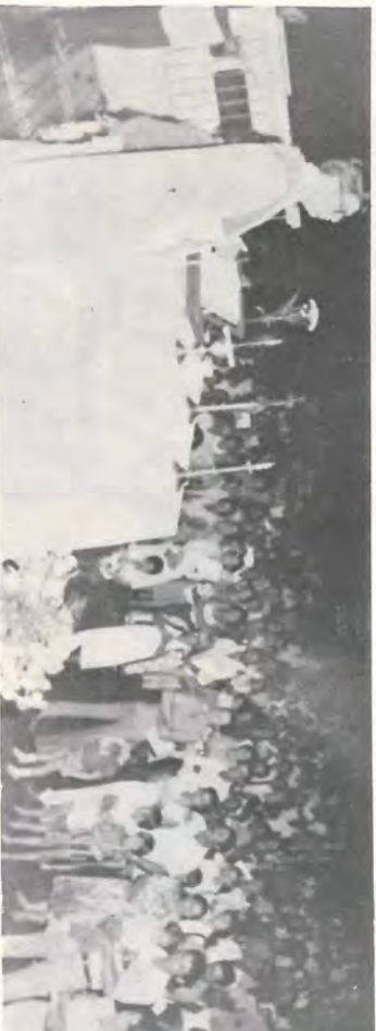
Fragrantes do Natal Comunitário que reuniu o pessoal de Serrana e Fazenda da Pedra no Estádio Irmãos Biagi.