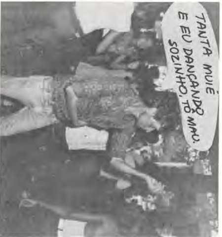
TANTA MUIE E EU DANÇANDO MUA, E SOZINHO, TO