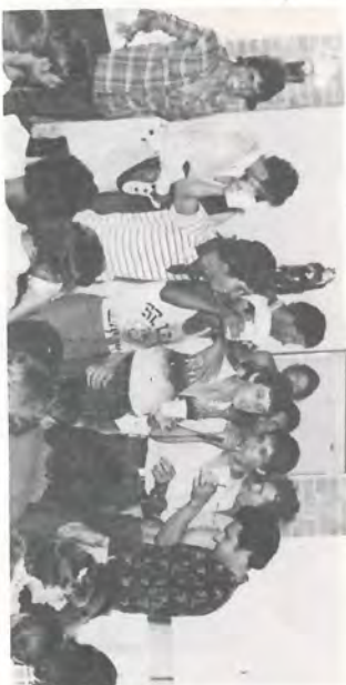
Esses moços do Transwal e Laranja também animaram a festa.