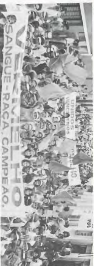
Flagrantes da Caminhada realizada pelas Equipes saindo de Serrana até o Estádio Irmãos Biagi.