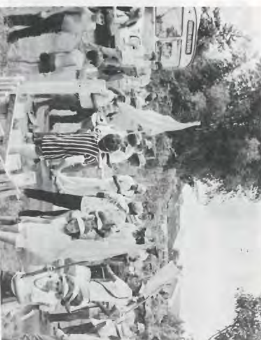
BATUCADA AMARELA (à esquerda) e VERMELHA (à direita) na concentração defronte nossa Sede, na saída da Caminhada, dia 21.