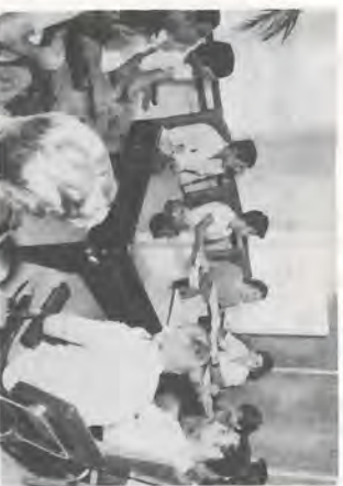
Flagrantes da reunião da Cipa/Usina.

No dia 27 de abril, na Sala de Reuniões do Escritório/Usina, às 9:00 horas, foi realizada a sétima reunião da XII Diretoria da Cipa/Usina.