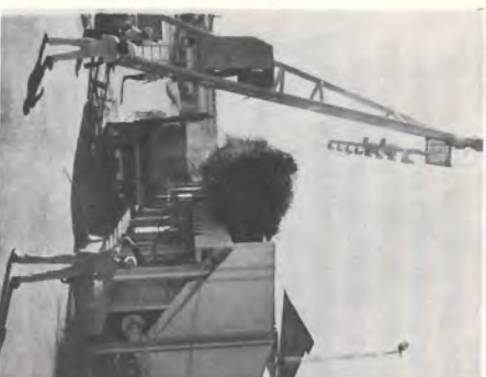
As primeiras canas inteiras são descarregadas.

Mais uma cuidadosa entrega, cumprida com entusiasmo e dedicação, tudo muito bem feito e no prazo correto. Terminado o projeto de expansão, vem agora os primeiros "restes", já então para valer, pois estamos fabricando açúcar e álcool.