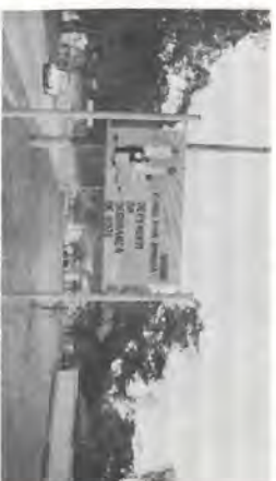
A nova placa colocada pela Cipa.

A CIPA/CARPA tem se empenhado muito no sentido de resguardar a integridade física dos trabalhadores.