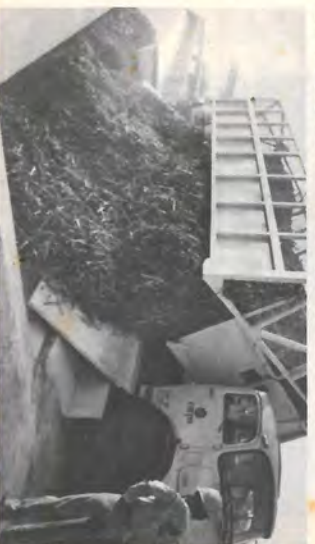
Momento em que eram descarregadas as primeiras canas dando início a safra 82/83.