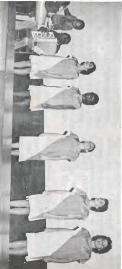
Prova da Música - Apresentação da Equipe Verde