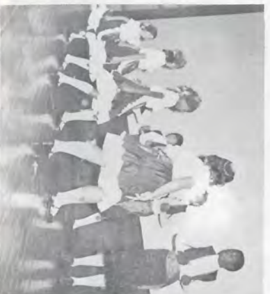
Dança - Apresentação da Equipe Vermelha.