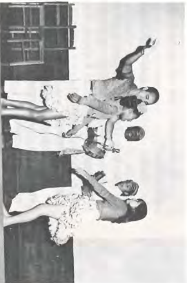
Prova da Música - Apresentação da Equipe Vermelha.