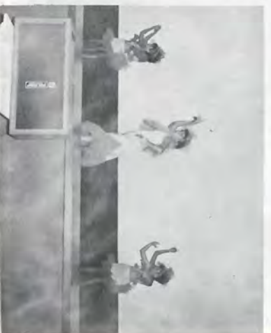
Dança - Apresentação da Equipe Azul.