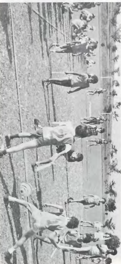
Disputa de Hoquei com Bastão das Equipes Verde e Vermelho.