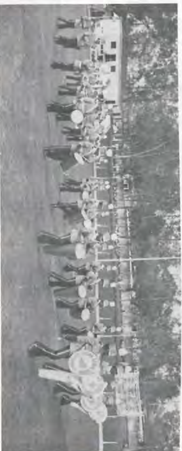
Banda Marcial da Usina Santa Elisa em seu novo uniforme.