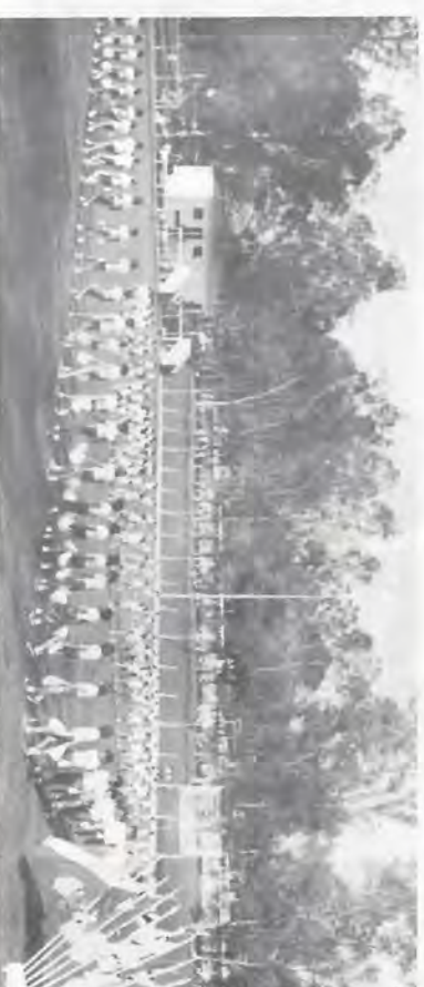
A formação do Caracol.