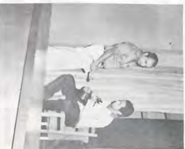
Prova de Música - Apresentação da Equipe Amarela