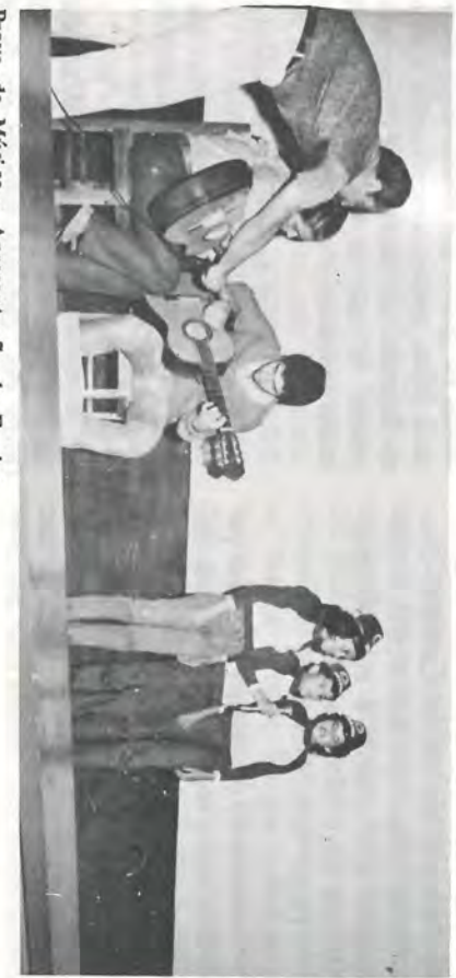
Prova da Música - Apresentação da Equipe Azul