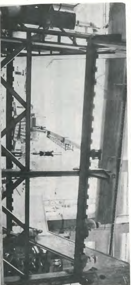
Mesa inclinada para lavagem de cana do pátio para moenda A.

Em atendimento ao Programa de melhoria da qualidade das águas dos nossos rios, foi instalado um sistema de decantação para a água de lavagem de cana que operará um circuito fechado. Este sistema já testado e instalado em algumas boas usinas, Santa Elisa por exemplo, dependendo da chegada de alguns equipamentos importados, entrará em operação em meados do mês de julho.