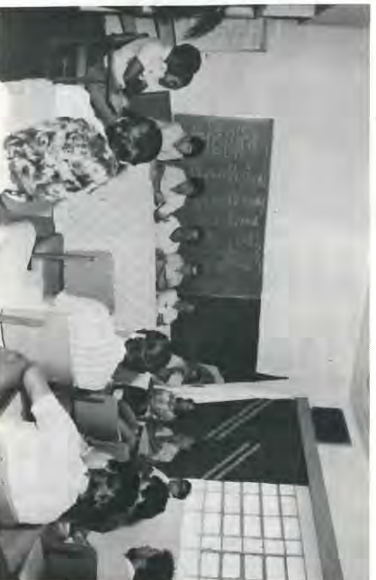
Composição da mesa