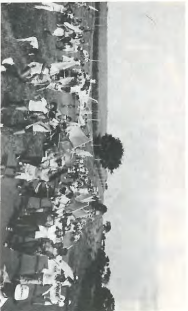
Flagrantes da Caminhada de Abertura saindo de nossa sede em Serrana até a Fazenda da Pedra, com 300 participantes - 150 de