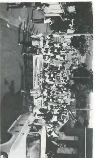
cada equipe. Ponto para as duas equipes.

Terminou o IV FEVA com a Equipe VERMELHA tri-campeã e merecidamente de posse definitiva do belo troféu. Todos esses "FEVAS" foram altamente positivos e sem dúvida alcançaram os objetivos "Integração entre todos os elementos da Empresa".