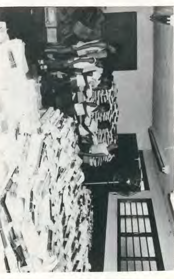
No início das aulas, todos os filhos de funcionários que cursam o 1.º Grau, receberam uma parte do material escolar. Na foto, algumas crianças de Serrana, quando retiravam seus materiais.