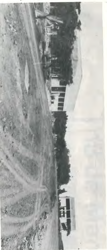
Novas balanças de 100 ton. e laboratório para controle de qualidade da cana.