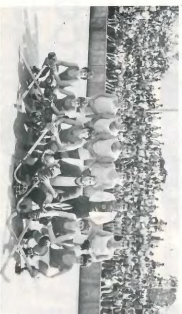
Eles vieram de Sertãozinho e realizaram uma partida de Hóquei sobre Patins. Sem dúvida, umas das melhores atrações da tarde de domingo no encerramentos do FEVA. Obrigação, pessoal!