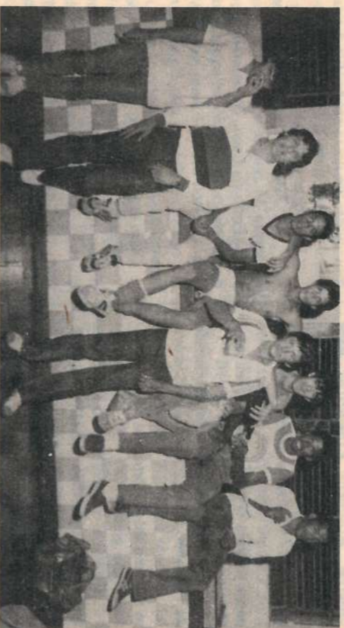
Comemoração final: a cervejada que o Bizutti não pagou.

Tá aí, gente! O Torneio provocou maior união entre os funcionários da