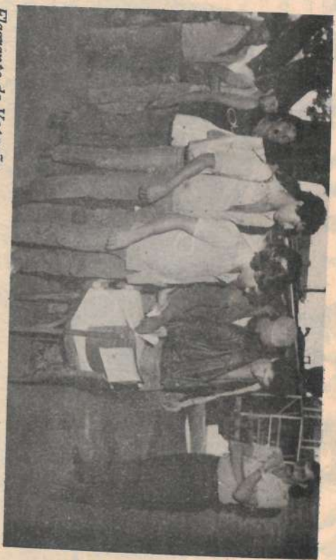
Flagrante da Votação.

Os funcionários da Usina votaram nos dias 01, 02 e 03 de agosto para escolher os companheiros que serão seus representantes na Comissão Interna de Prevenção de Acidentes, a CIPA.