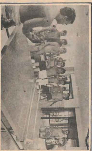
As mesas de jogos estavam sempre ocupadas.