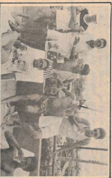
Depois de dançar o break, uma pausa para tomar fôlego.