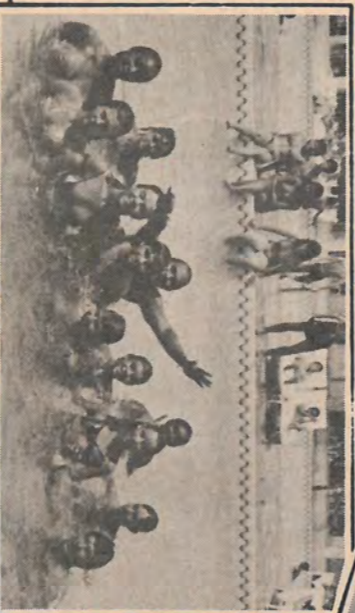
Depois da praia, o pessoal curtiu as áreas de lazer da Colônia.