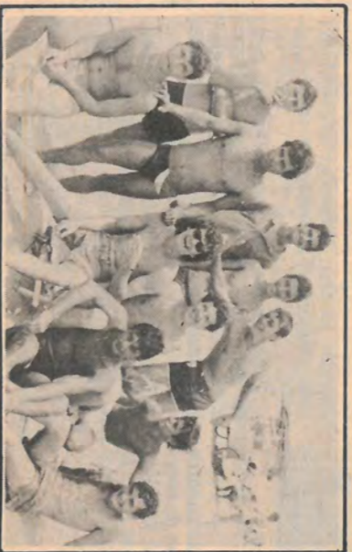
Que vidão, heim meninos!