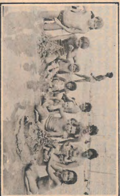
A garotada se divertia fazendo os castelos de areia.

curtiram bastante. Estava tudo muito bom. Aconteceram alguns pequenos contratempos, normais quando grandes grupos se reúnem, e, pela primeira vez, ocorreram problemas disciplinares com um grupo de rapazes, o