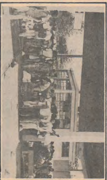
Entrega dos presentes na Usina.