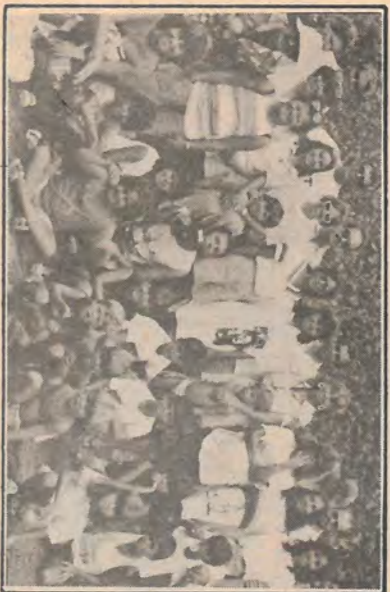
Aqui o grupo faz a pose