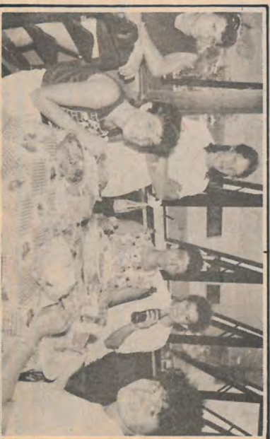
"A hora da refeição é sagrada", não é mesmo, pessoal!