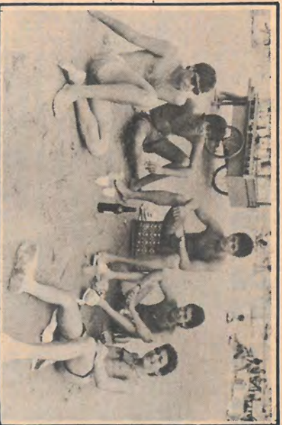
Olha aí os meninos curtindo a onda dos brinquedos.