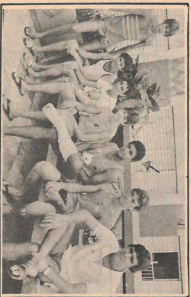
Que azar, heim Jadiri!