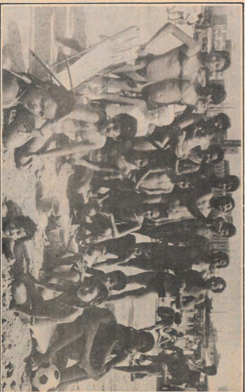
Sol, praia, caipirinha! Que delícia, heim pessoal!