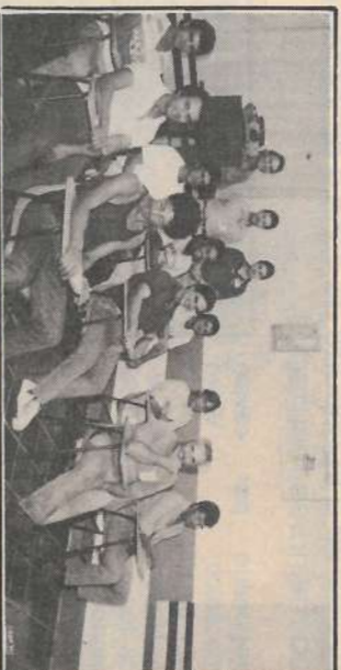
Comboistas no aperfeiçoamento técnico.

sobre Segurança no Trabalho e os Benefícios do Serviço Social para funcionários e dependentes. Foi um bom trabalho!