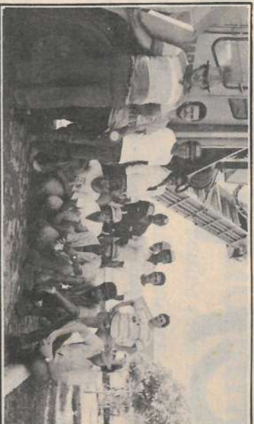
Aula prática do curso "Manutenção Preventiva e Funcionamento do Sistema Hidráulico de Colhedeliras de Cana".

Na Usina, destaque para as Palestras de Integração para os funcionários contratados para a safra. Nestas palestras o pessoal toma conhecimento das Normas Internas da Empresa, bem como recebem orientação