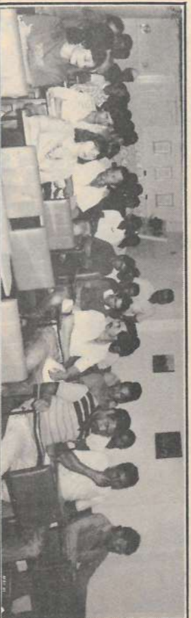
Participantes do curso na entrega dos certificados.