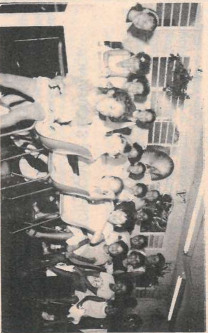
Que clubinho animado!