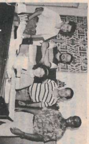
Equipe do Depto de Pessoal da Usina