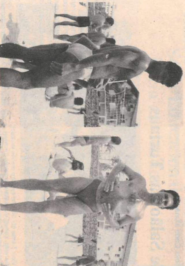
"Esses fotógrafos! Seriam minhas pernas?"