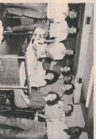
Seção de pessoal/ Carpa e Filial