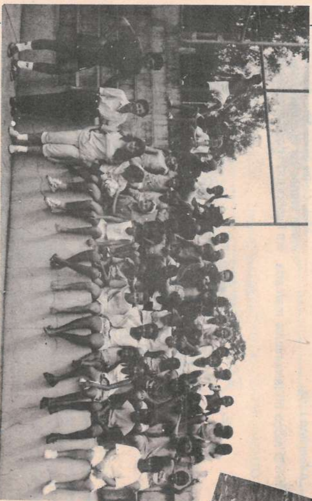
Um dos grupos da escolinha após a aula: vitaminado pra todo mundo