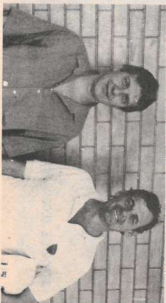
Eivio e Carnaval