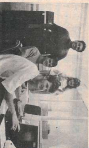
Equipe do CPP