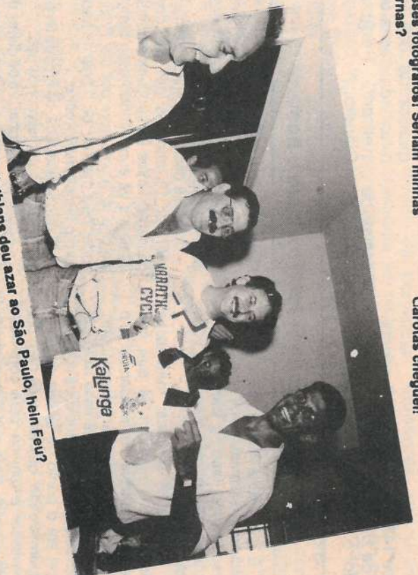
A camisa do Corinthians deu azar ao São Paulo, hein Feu?

(Colaboração Laércio Pin - Contabilidade/Usina)