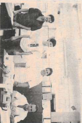
Pessoal da Apontadoria/Carpa e Filial

Por esta e pelas outras vezes, valeu, pessoal!