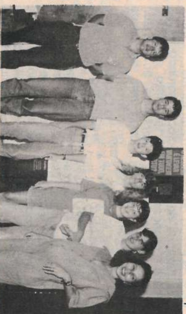
Formandos de 91