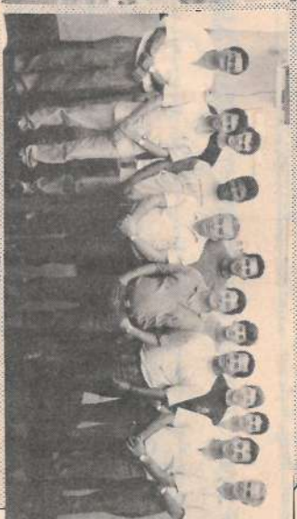
Conhecimentos Básicos de Tributos