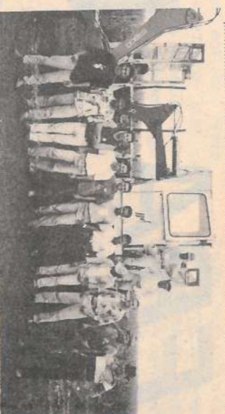
Formação profissional: Operadores de carregadeira