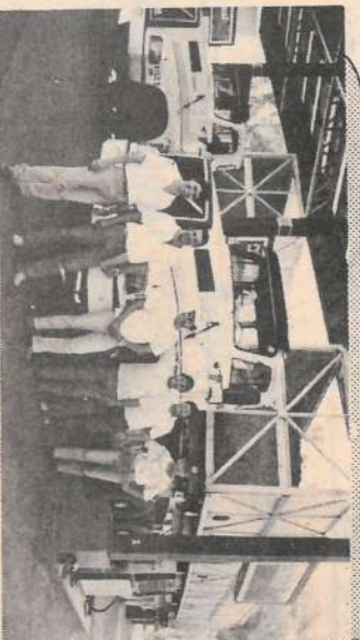
Condução Econômica: Caminhão Volvo