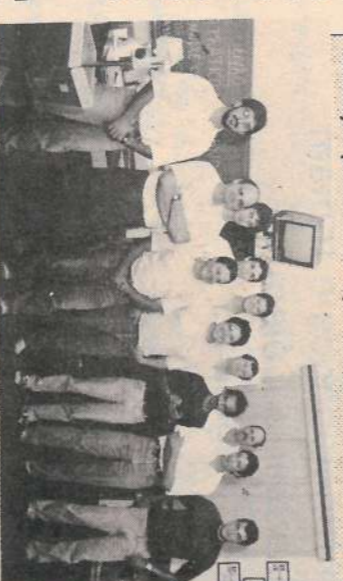
Auto-Cad: aula teórica