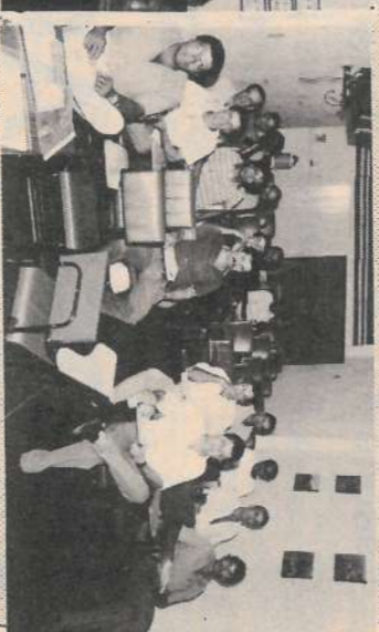
Operação de Filtros