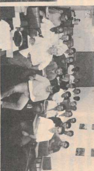
Operador de Turbinas