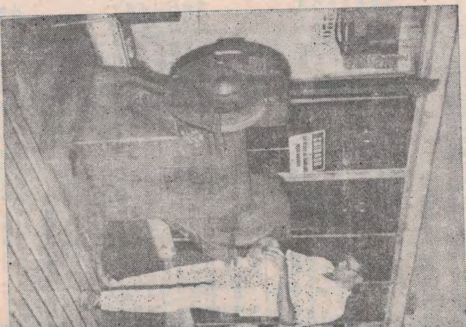
P O S I Ç Ã O E R R A D A