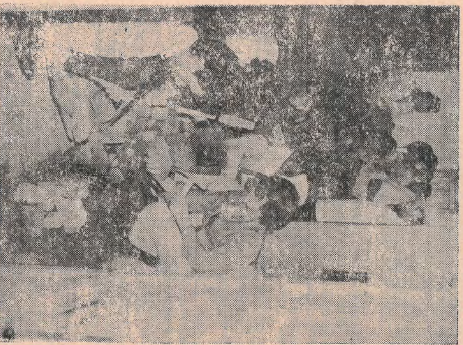
2) — CURSO DE ARTE CULINARIA no Clube