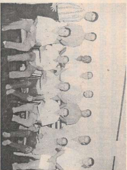
Uma das turmas do Curso

O Setor Treinamento terminou no final de setembro o curso Relacionamento Humano e Supervisão de Equipes que faz parte do Programa Desenvolvimento de Lideranças. O curso foi ministrado para 94 funcionários que compõem o quadro de chefia e liderança da mão de obra rural, bem como para supervisores, encarregados e líderes da Divisão Agrícola.