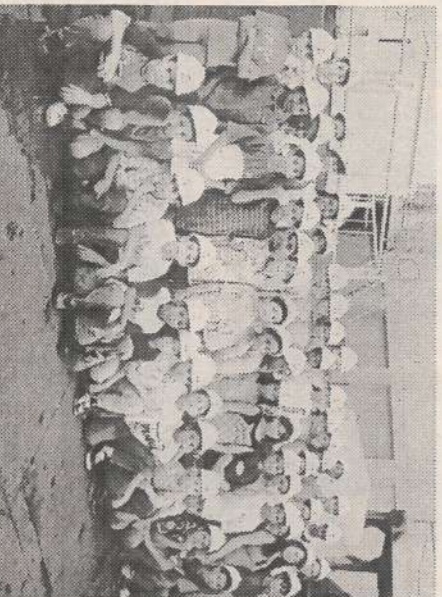
A primeira visita, foi de alunos da 4ª série da escola Edésio.