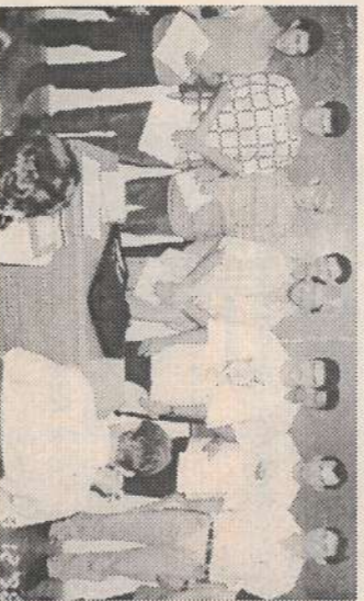
Alunos do curso noturno que concluíram a 4ª série.

O Projeto Telecurso 2000 em Buriti, logo no início, deu frutos: 20 funcionários que há muito haviam deixado os estudos, passaram por uma prova e conseguiram o Certificado de Conclusão da 4ª série, e seguem estudando. Parabéns a todos!