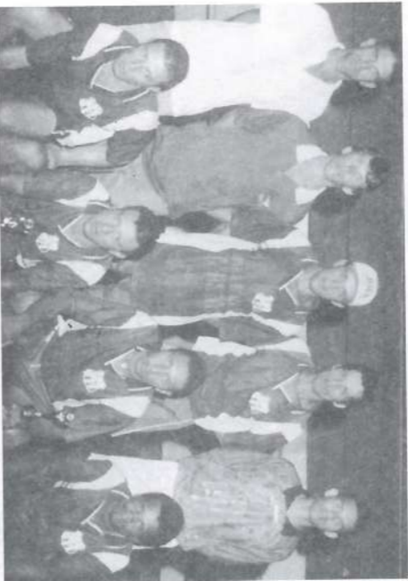
Turma 26/ Cravinhos, a grande campeã.