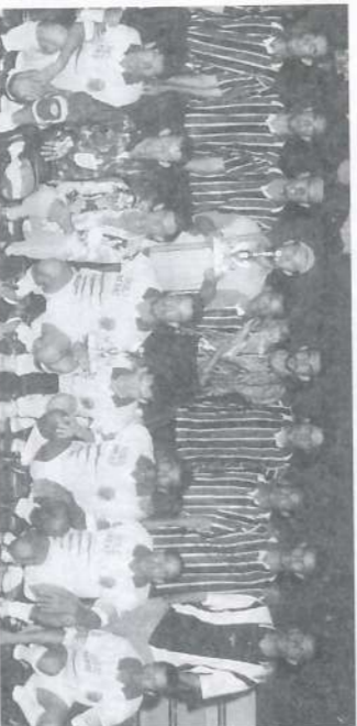
Turma 03, de pé, 3º lugar e Turma 06, agachada, quarta colocada.