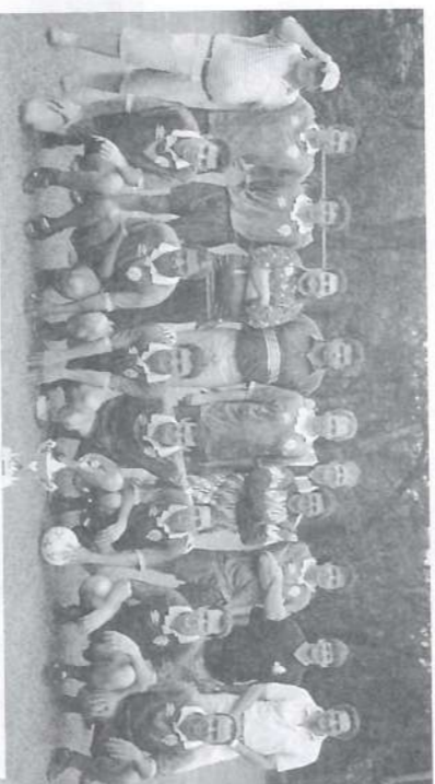
Campeão: Administração Usina da Pedra.