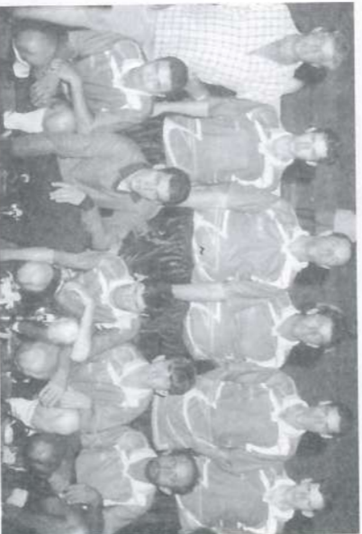
Turma. 08, vice, pela segunda vez consecutiva.