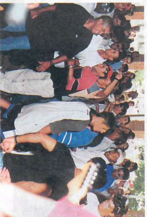
Animação da moçada...