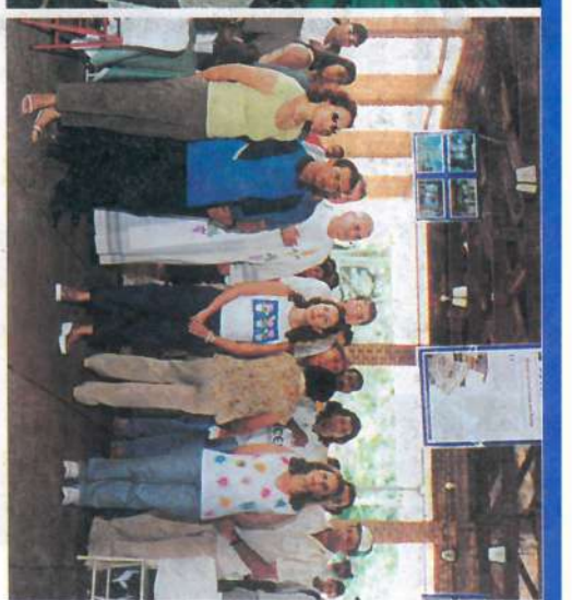
O Hino Nacional marcou a abertura das Festas.