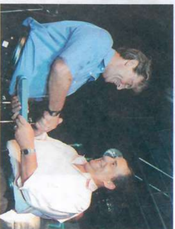
... e a comemoração com a família