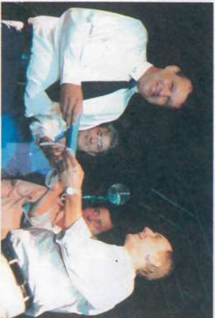
Entrega do Relógio de Ouro...