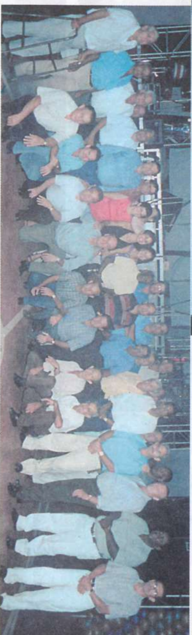
Funcionários aposentados que já receberam o Relógio de Ouro cantaram o Parabéns dos 70 Anos.