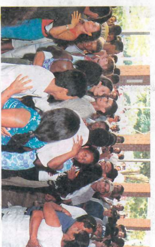
Dança no compasso...