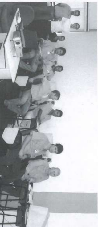
Funcionários da Usina em treinamento "Pesquisa no Cadastro de Materiais".