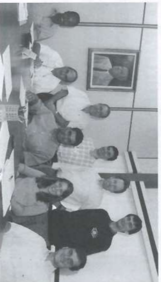
Esta equipe, juntamente com outros funcionários, trabalhou no desenvolvimento e implantação do Projeto.