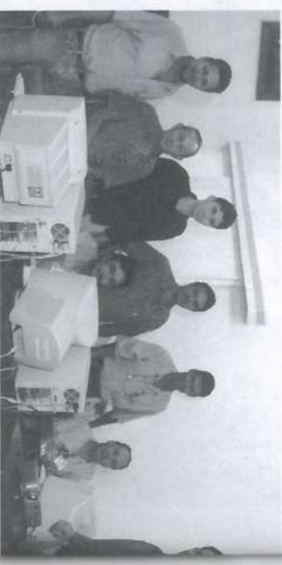
Funcionários da Oficina, da área Agrícola e da Usina em treinamento de "Solicitação Eletrônica de Materiais".