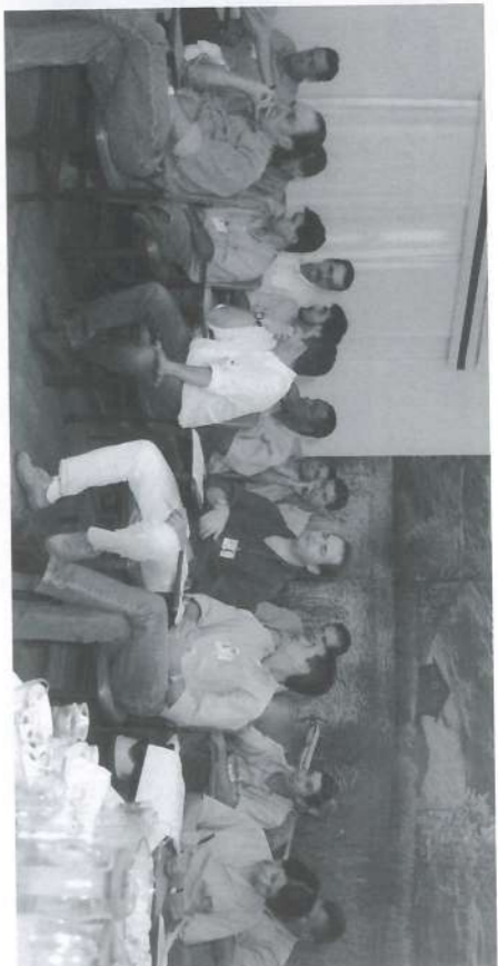
Reunião de fechamento da auditoria na Pedra com os mesmos auditores que auditaram a Ibirá.