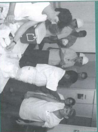
Vacinação na Usina.

Foram vacinados funcionários da Oficina de Máquinas e Veículos, do Escritório Central e da indústria. As pessoas interessadas atualização de suas vacinas podem procurar o Centro de Saúde.