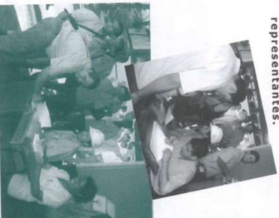
Funcionários da Indústria também fizeram suas escolhas.