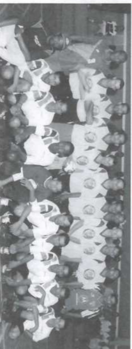
Em pé, Reflorestamento - Serrana. Agachados, Turma 31 - Altinópolis.