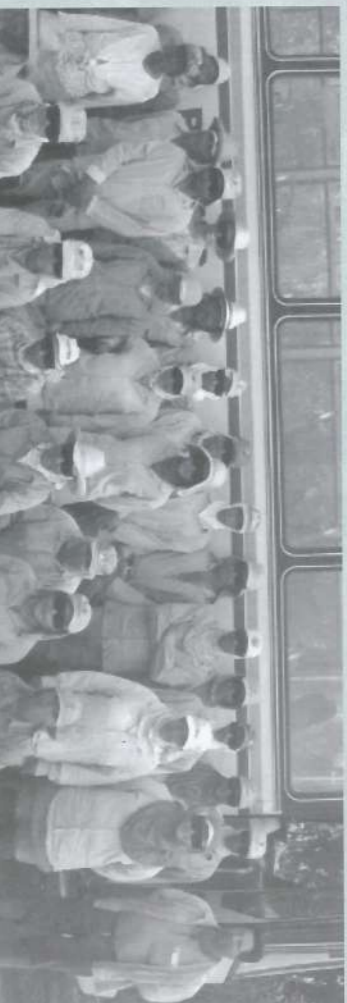
Esta é a Turma 10, de Santa Cruz que trabalhou na Colheita de Laranja.