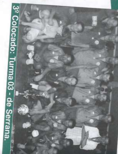
3º Colocado: Turma 03 - de Serrana.