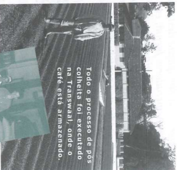
Todo o processo de pós colheita foi executado na Transwaal, onde o café está armazenado.

"Para este ano agrícola iniciaremos a reforma da cultura com plantio de 75 000 mudas na Fazenda São João 1. Trata-se do Projeto de Reforma e Transferência das áreas de café para locais mais próximos ao beneficiamento e adaptados ao desenvolvimento da cultura. Além disso, empregaremos novas técnicas de manejo,