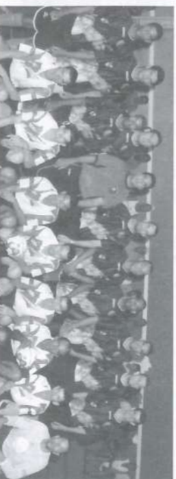
Em pé, Turma 19 - Serrana. Agachados, Turma 8 - Serra Azul.