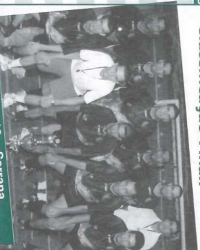
Campeã: Turma 19 - Serrana.