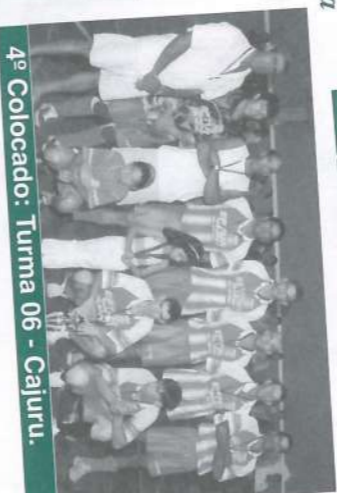
4º Colocado: Turma 06 - Cajuru.