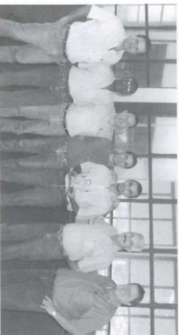
O pessoal do Transporte-Controle de Tráfego recebeu com alegria mais esse merecido prêmio.