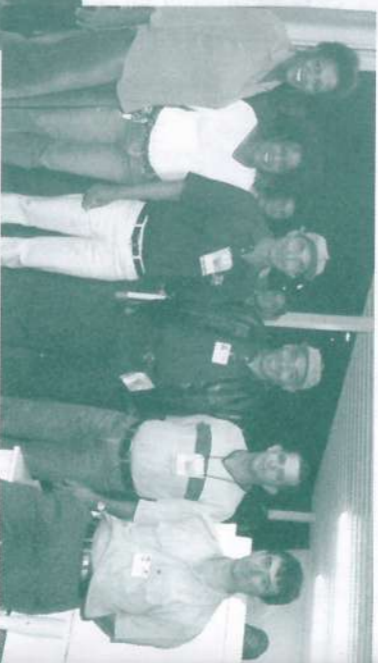
Responsáveis pelo estande da Garapa