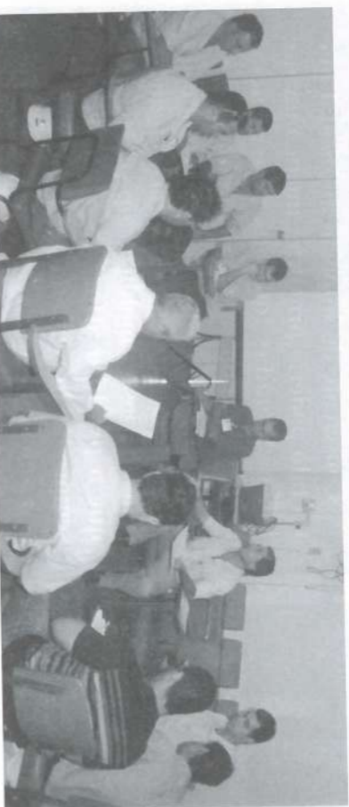
Funcionários da Pedra em treinamento para auditoria interna do 5 "S".

Os auditores tem um papel fundamental em suas áreas de trabalho: eles cuidam para que os conceitos do 5 "S" não caiam no esquecimento, conscientizando os membros da equipe para que mantenham o ambiente de trabalho limpo e organizado.