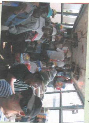
Entrega dos presentes para os funcionários da Mão de Obra Rural.

Muita alegria na entrega dos brinquedos para os filhos dos funcionários da Usina Buriti. A retirada foi no Almoxarifado e graças a organização do pessoal, foi tranquila, inclusive com a presença de alguns crianças.