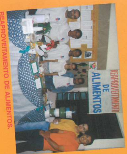
REAPROVEITAMENTO DE ALIMENTOS.

Nos dias 01 e 02/dezembro, funcionários da Ibirá participaram da Feira "Exposição de Projetos Educacionais de Química", da Escola Municipal Geraldo Magela Ribeiro, apresentando os seguintes projetos: