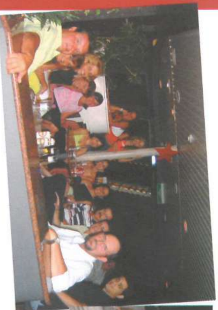
O jantar de gala, na "Noite do Comandante" foi um dos tantos bons momentos vividos pelo Grupo.

O enjôo de alguns não impediu que aproveitassem muito as opções de lazer e o conforto que o Navio oferecia, inclusive quando aportaram em Fernando de Noronha e conheceram as belezas naturais deste "paraiso ecológico" como é conhecido o Arquipélago.