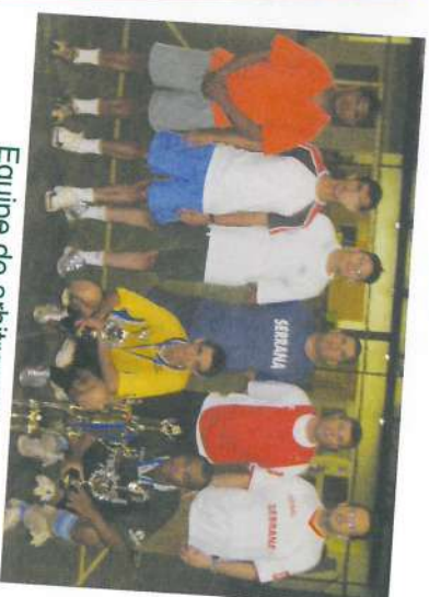
Equipe de arbitragem