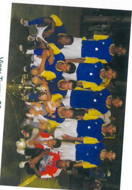
Vice: Turma 52