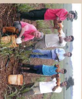
Equipe de Amostragem de Solo.