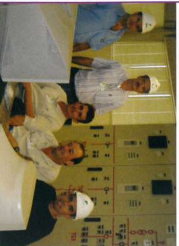
Sala de comando - Operação da CERPA.

(*) vapor vegetal é o vapor proveniente da água evaporada do caldo da cana.