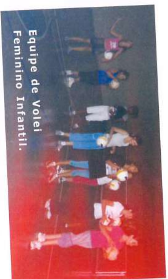
Equipe de Volei Feminino Infantil.