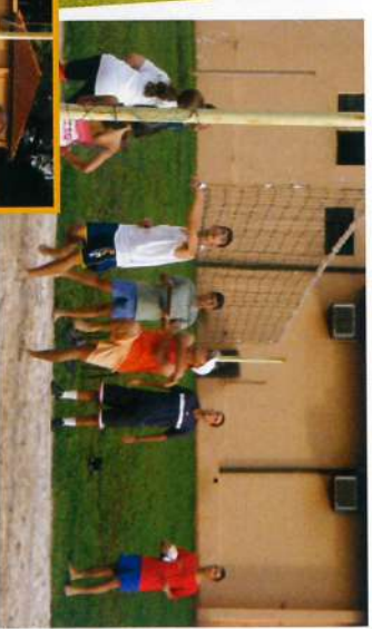
"Nossa homenagem ao Cónsul"