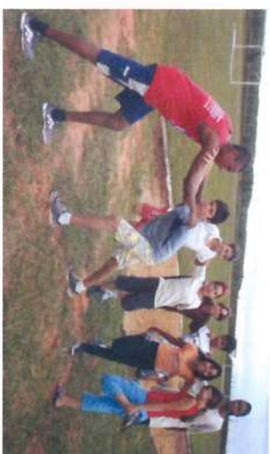
Equipe Mista Infantil de Atletismo em treinamento de 80m.