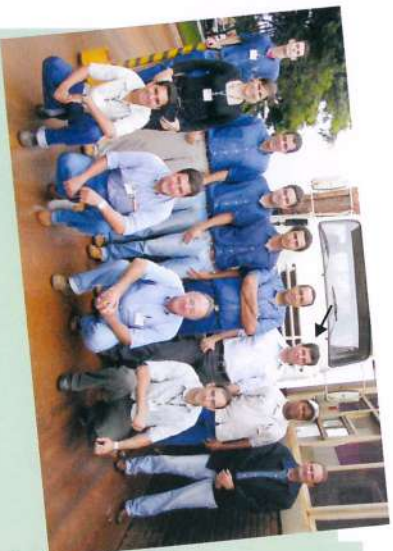
Usina Buritti: 11ª Safra