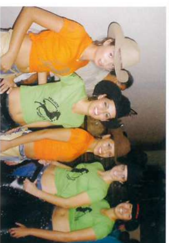
Equipe Juvenil de Dança.