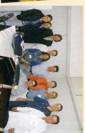
Reunião de avaliação das auditorias,

10.agosto - Burity, 29 e 30.setembro - Pedra 17 e 18.outubro - Ibirá.