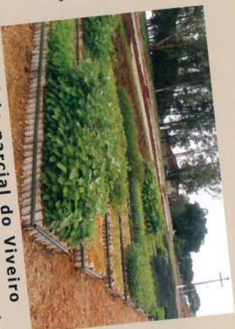
Vista parcial do Viveiro localizado na Fazenda da Pedra.

Algumas destas práticas já são adotadas há vários anos, e foram aperfeiçoadas, resultando na produção da cana-de-açúcar de qualidade, sem deixar de cumprir a legislação ambiental em vigor.