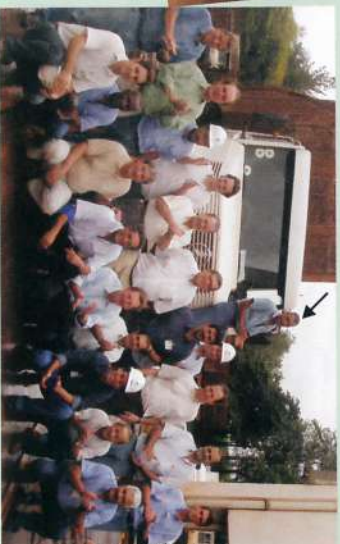
Usina da Pedra: 74ª Safra

De 25 de abril a 30 de novembro 220 dias