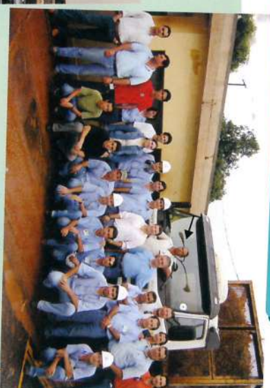
Usina Ibirá: 8ª Safra