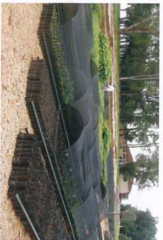
■ Instalação de viveiros de mudas nativas e Prática de Reflorestamento e Reposição de Matas Ciliares, conforme Projeto de Adequação Ambiental.