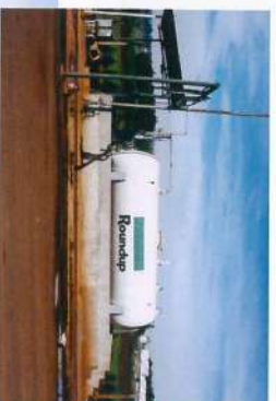
■ Suprimentos: Uso racional de embalagens- bulks e big bags, para insumos: adubos e defensivos.