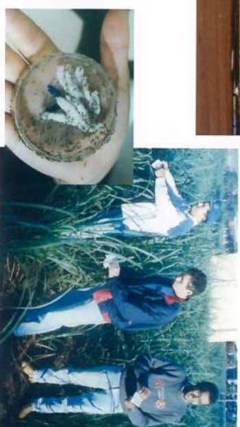
■ Controle Biológico de Pragas com liberação da vespa Cotesia e aplicação do fungo Metarhizium.