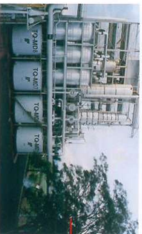
■ Instalação da Peneira Molecular na Destilaria para fabricação de álcool sem benzol (produto cancerígeno)