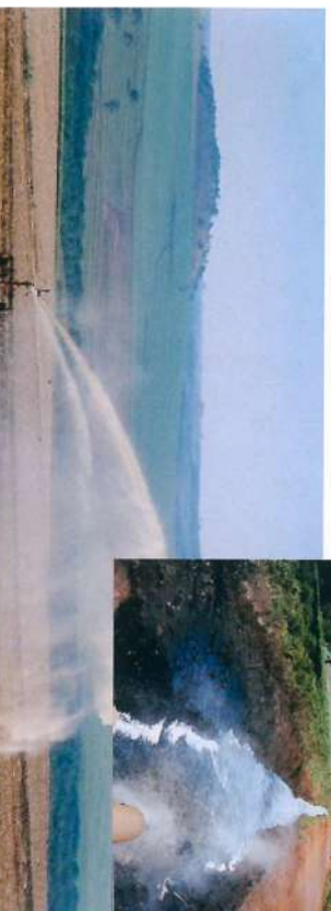
■ Utilização da Vinhaça na lavoura de cana, conforme orientação da CETESB.