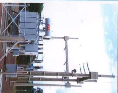
■ Instalação da CERPA - Central Energética Rio Pardo para cogeração de Energia, a partir do bagaço da cana.