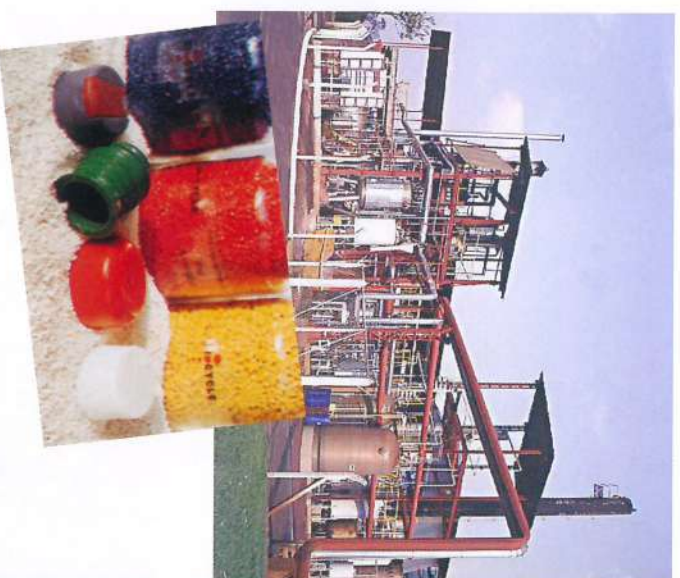
■ PHB- tecnologia limpa na produção de matéria-prima para fabricação de produtos plásticos biodegradáveis, de uso rápido, como os descartáveis