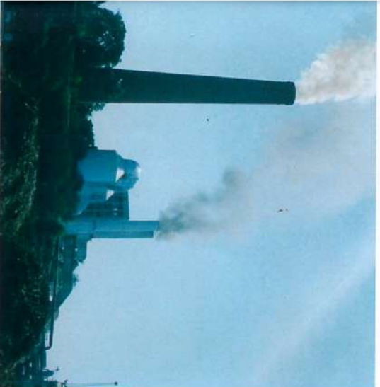
■ Instalação de Sistema de Eliminação das Partículas dos Gases das Caldeiras