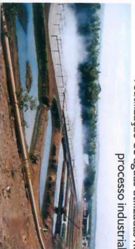
■ Circuito Fechado das Águas com reutilização de águas utilizadas no processo industrial.