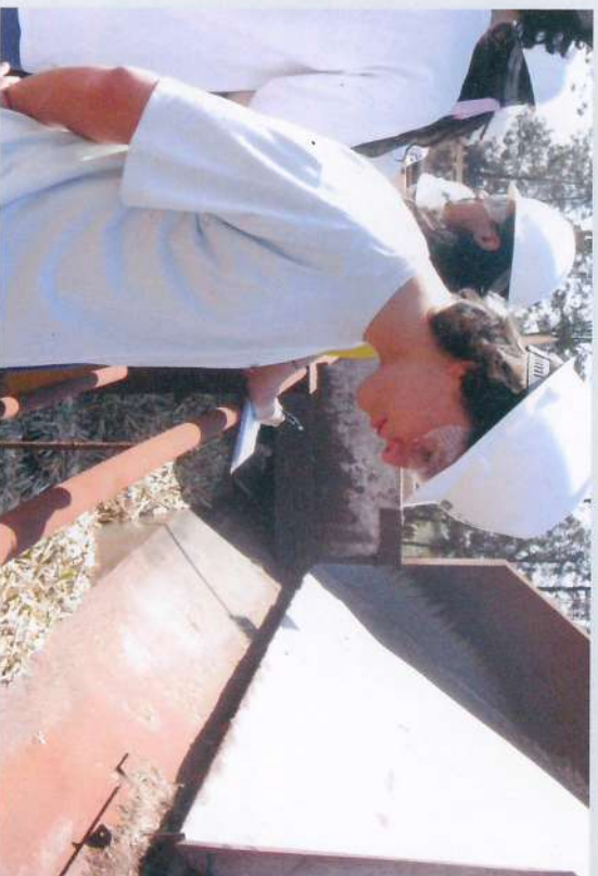
Há alguns anos a Usina da Pedra está no roteiro de uma viagem de estudo do colégio Equipe ao Interior.

Além dessas visitas, a Pedra, Buriti e Ibirá continuam recebendo as Escolas que participam do programa "Agronegócio na Escola", desenvolvido pela ABAGRP, e a Pedra novamente recebeu alunos do ensino médio do colégio Equipe- São Paulo.