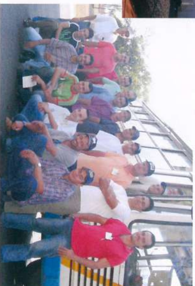
Um dos grupos de funcionários em intercâmbio na Pedra e Buriti para Treinamento e Desenvolvimento.