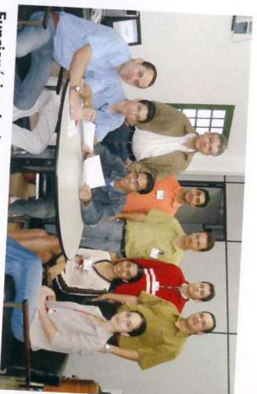
Funcionários da área Administrativa e Agrícola.