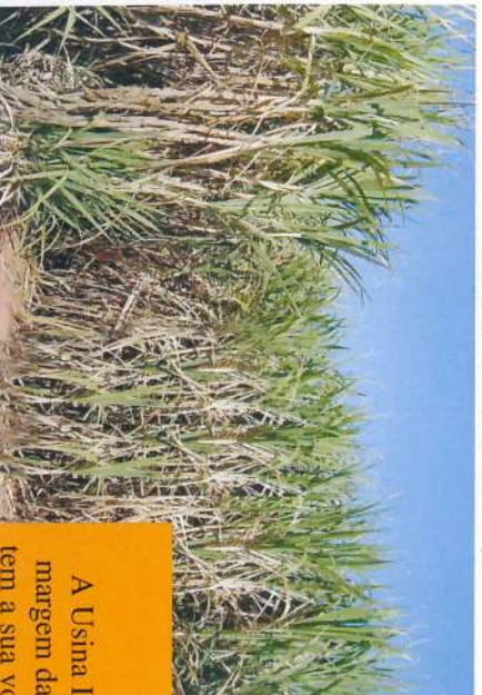
Primeiros canaviais da Ipê.