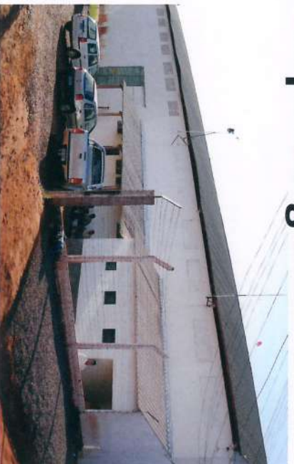
Neste prédio, em Nova Independência, funciona o escritório da Ipê.

Também conheceram o histórico, atividades e a produção da Empresa nas Usinas da Pedra, Buriti e Ibirá, a cogeração de energia através da CERPA, a pecuária da CARPA e amostras de produtos fabricados com PHB - o plástico biodegradável, produzido pela PHB Industrial S/A, localizada na Usina da Pedra.