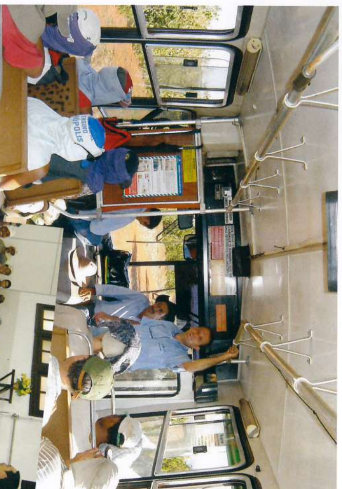
Algumas reuniões foram no local de trabalho, dentro do ônibus, e outras em salas de Treinamentos.