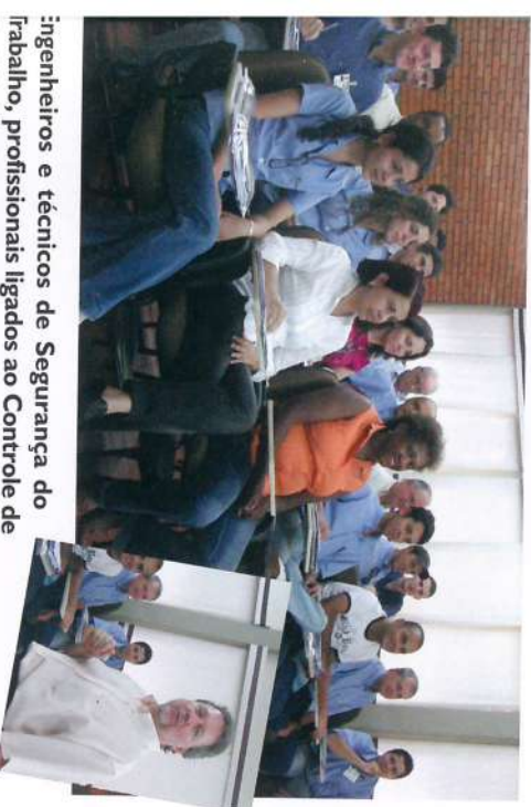
Engenheiros e técnicos de Segurança do Trabalho, profissionais ligados ao Controle de Qualidade e Meio Ambiente, médico do Trabalho, representantes do setor de Treinamento e Desenvolvimento e Segurança Patrimonial, participaram do Curso.

A OSHAS é uma Norma compatível com a ISO 9001 (Qualidade) e ISO 14001 (Meio Ambiente) e pode ser aplicada a todos tipos e portes de empresa.