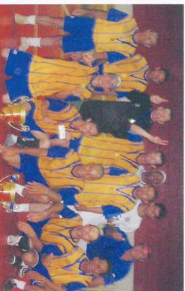
Campeã: Turma 52