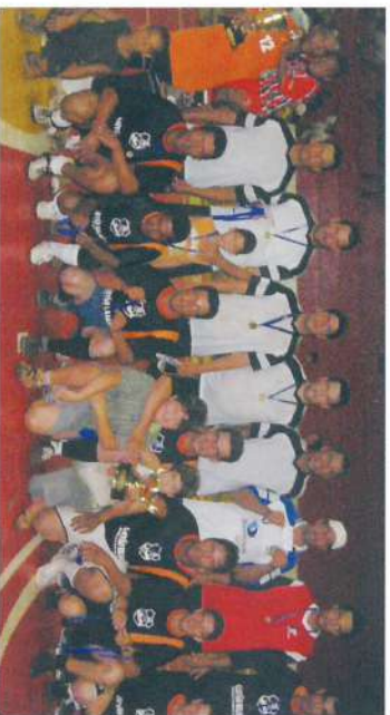
3º lugar - Herbicida, de pé e 4º lugar, Experimento.