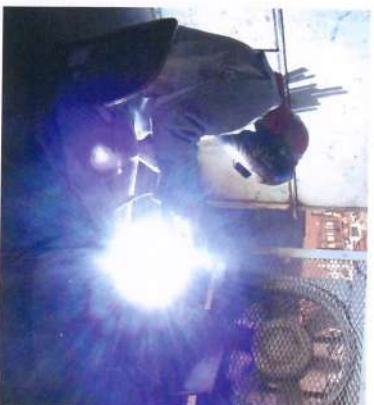
As competências necessárias ao cargo de soldador já foram mapeadas pelo Comitê.