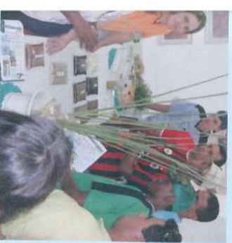
Cerca de três mil estudantes visitaram a Feira

A PHBISA, também convidada, expôs amostras de peças manufaturadas resultantes da tecnologia do Plástico Biodegradável desenvolvido a partir do açúcar da cana.