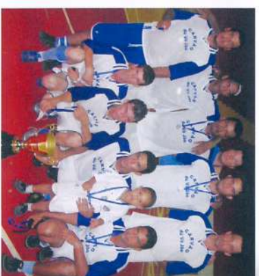
Vice-campeã: Turma 20