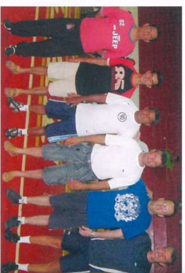
Equipe de arbitragem