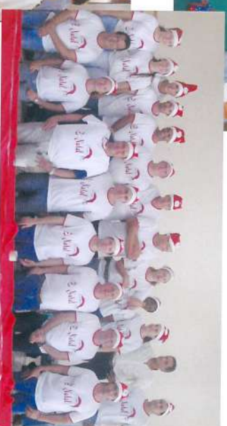
Equipes de distribuição das cestas e brinquedos, Buriti e Ibirã.