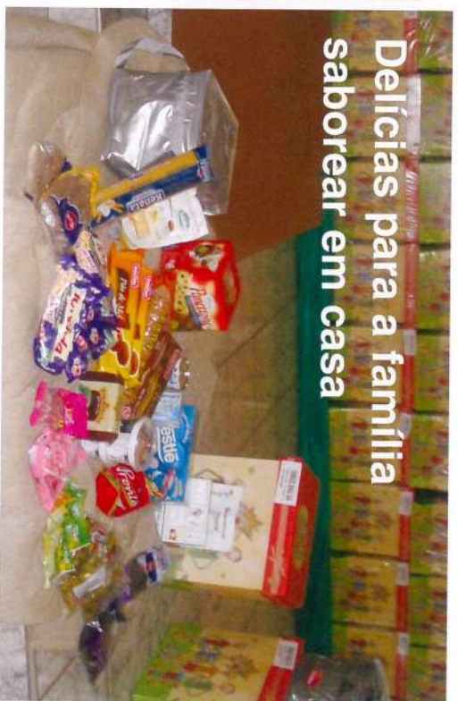
Delícias para a família saborear em casa