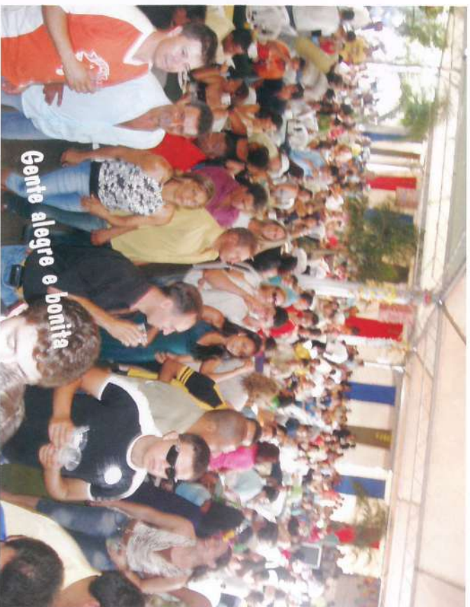
Gente alegre e bonita