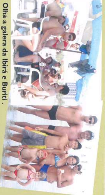
Olha a galera da Ibirá e Burity.