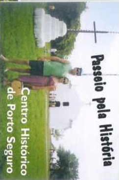
Centro Histórico de Porto Seguro