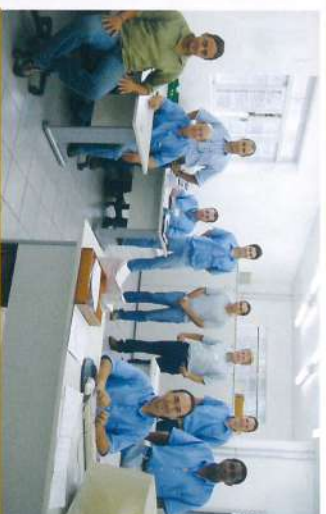
Escritório da Oficina Automotiva do Departamento de Manutenção