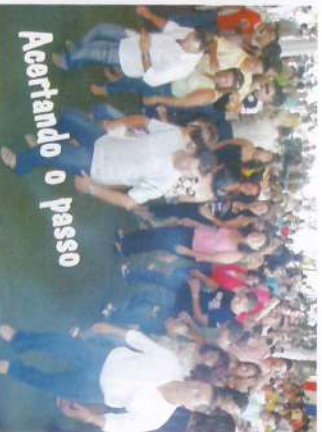
Acertando o passo