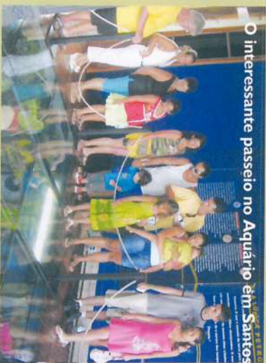
Lugar de família feliz