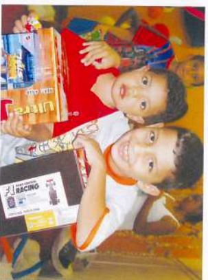
A entrega de brinquedos foi uma festa e cada Usina preparou a sua. Em todas a presença do Papai Noel e outras atrações para a alegria da garotada.