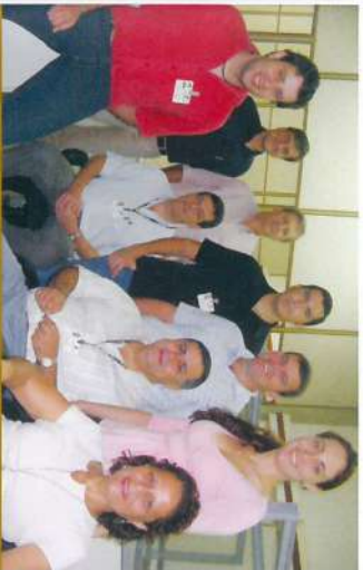
Departamento de Suprimento de Materiais e Compras