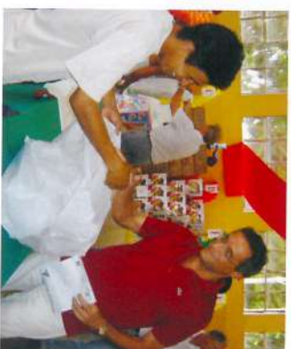
1740 cestas entregues aos funcionários da Mão de Obra Rural, Fazendas, Experimento, Combate a Pragas e Pecuária.