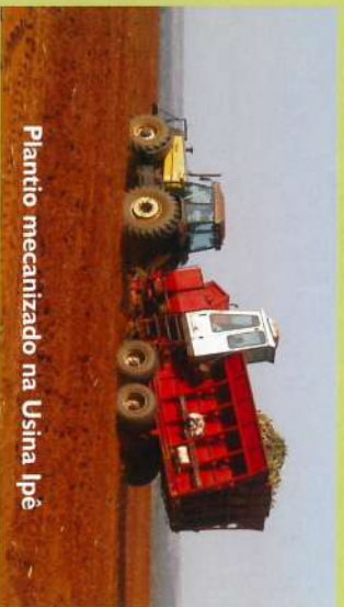
Plantio mecanizado na Usina Ipê