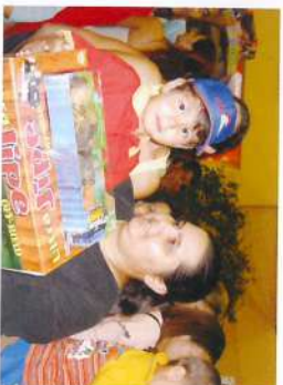
3440 brinquedos entregues.