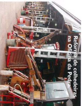
Reforma de colhedoras na Oficina da Pedra