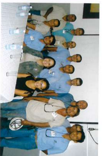
Usina Ibirá - 29 de março