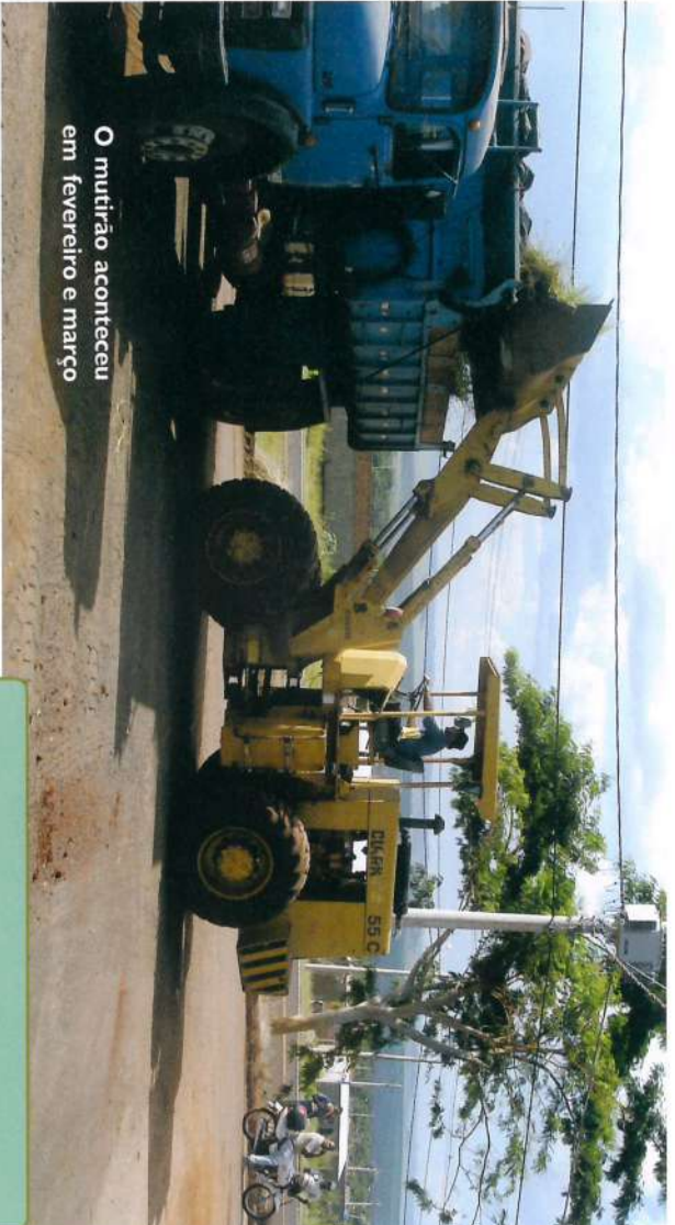
O mutirão aconteceu em fevereiro e março