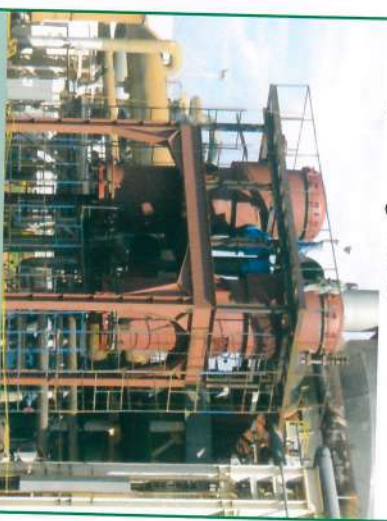
Instalação de mais dois pré- evaporadores

Além das melhorias na indústria, também a área administrativa foi contemplada com melhorias, como a construção do prédio para treinamento e ambulatório, a ampliação do refeitório e a adequação do layout da entrada da Usina, com relocação das guaritas.