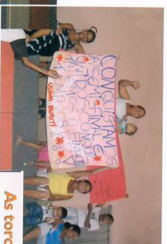
As torcidas prestigiaram seus times