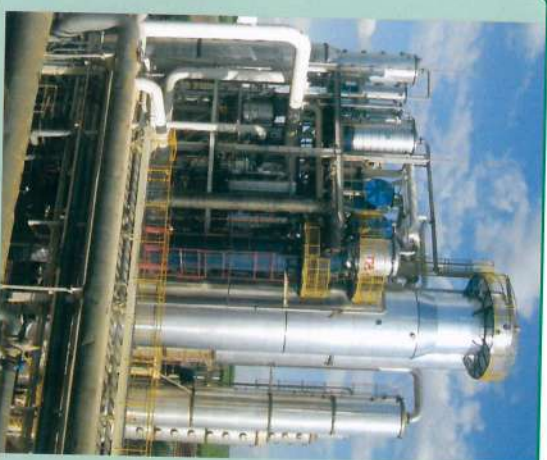
Repotenciamento do aparelho de álcool 120

SAIBA: Já tem alguns anos que o pátio de cana deixou de ser utilizado para esse fim. A decisão foi tomada com a introdução de uma eficiente logística de fornecimento de cana ao longo das 24 horas, não sendo mais necessário estocá-la para ser moída no período noturno, quando ocorria uma sensível redução da entrega de cana. Outro importante benefício é que quanto menos manipular a cana, melhor, porque com as movimentações, ela fica sujeita a esmagamento e contaminação, se degradando mais facilmente, e com isso, perdendo açúcar. Por isso, hoje o caminho descartrega a cana diretamente nas esteiras e mesas alimentadoras.