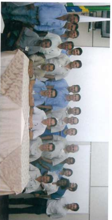
Usina da Pedra - 28 de março

Com a presença da direção da Empresa e convidados representantes de diversos setores das áreas agrícola, industrial e administrativa foram possosados os novos membros das CIPAs Irá, Pedra, Buriti e é. Nas solenidades de posse, ficou evidenciado apoio e prestígio que Empresa confere a PA, explicitando a visão de que é preciso continuar criando novos caminhos e novas ferramentas que possibilitem chegar acidente zero.