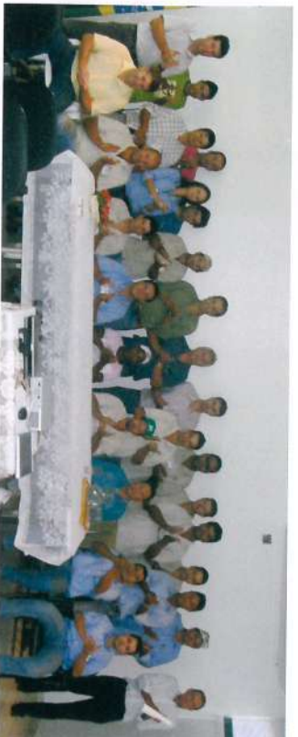
Usina Buriti - 30 de março