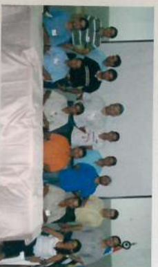
Representantes da CIPA Ipê que tomaram posse em 3 de abril