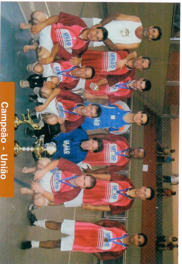
Campeão - União