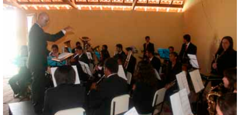
Na Usina Ibirá, a entrega dos presentes e todas as atividades para as crianças aconteceram ao som da Banda Sinfônica de Santa Rosa de Viterbo, patrocinada pela empresa, que deu um brilho especial ao evento