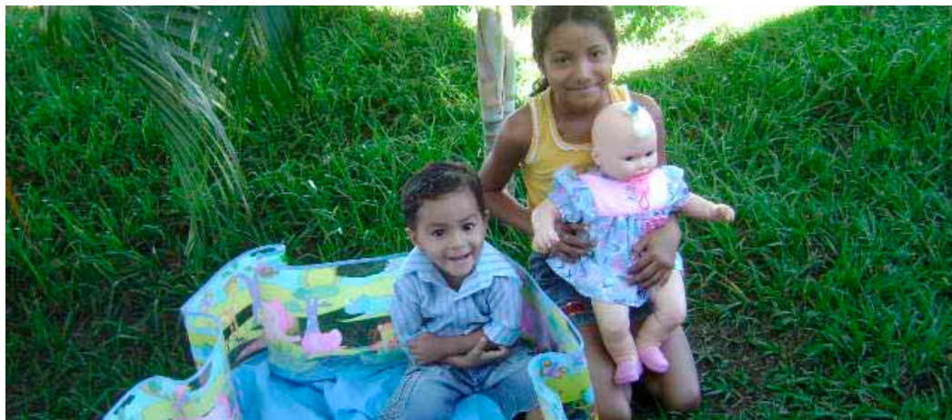
Na Barra do Graças, a distância não foi problema para o trenó do Papai Noel que chegou com os brinquedos para as crianças