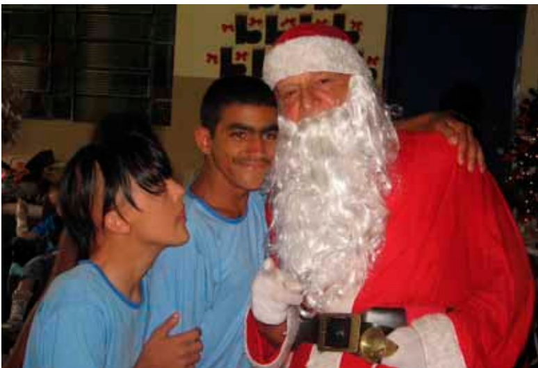
O “Bom Velhinho”, na APAE de Serrana, leva presentes para crianças e adolescentes durante o almoço de fim de ano da associação

As crianças do Lar Santo Antônio e Abrigo Santo André estiveram no evento e receberam brinquedos de presente de Natal. A Pedra Agroindustrial também presenteou com brinquedos, a APAE de Serrana. ”