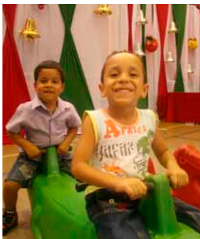
Crianças de todas as unidades acompanharam seus pais no evento e aproveitaram as atrações organizadas para elas; na Usina Buriti