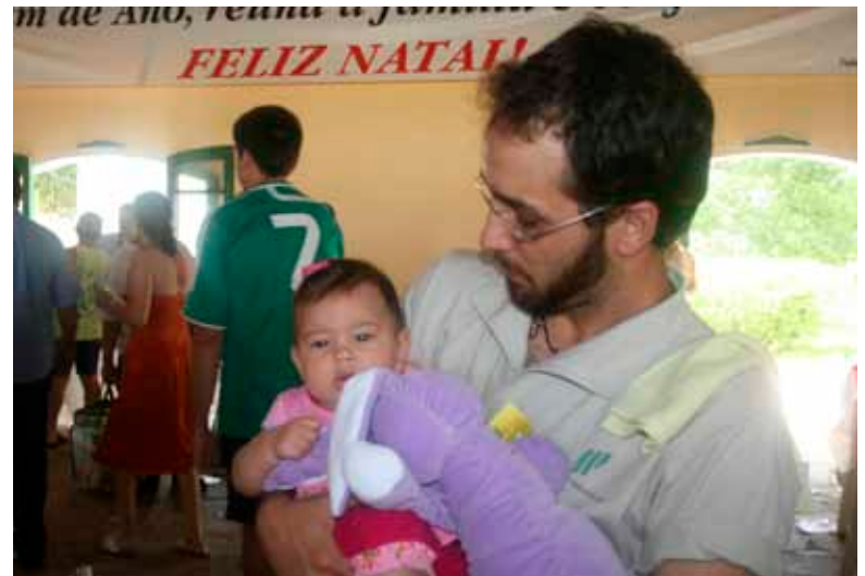
Projeto entrega brinquedos para crianças de todas as idades; na Ibirá