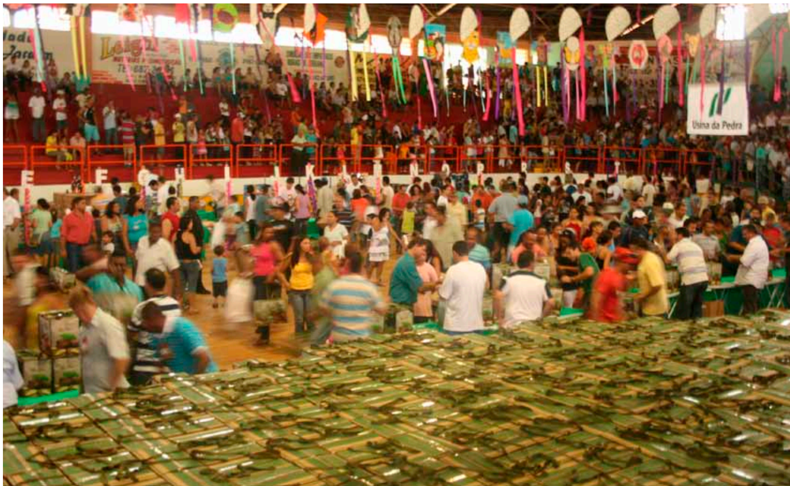
Grupo Pedra Agroindustrial distribuiu 4.722 cestas natalinas e perus, e mais 3.695 brinquedos entre as usinas da Pedra, Buriti, Ibirá e Ipê

Empresa entrega cesta de Natal, peru e brinquedos para funcionários e suas famílias