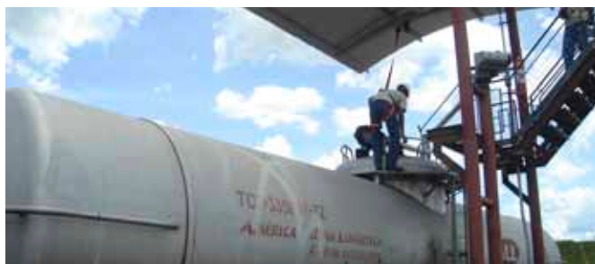
Vagões comportam 60 mil litros de álcool e o movimento diário chegará a 15 vagões

ferroviária de Andradina e facilita a transferência de álcool do veículo rodoviário para o ferroviário.