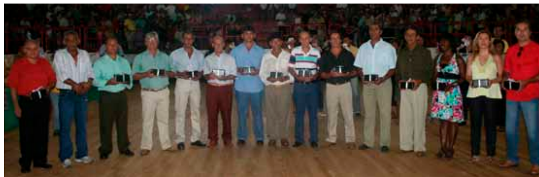
Homenagem foi feita no evento de distribuição de presentes aos funcionários