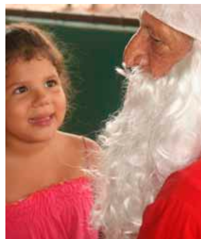
Papai Noel esteve no evento onde recebeu os filhos de funcionários para distribuir doces e ouvir seus pedidos de Natal; na Pedra