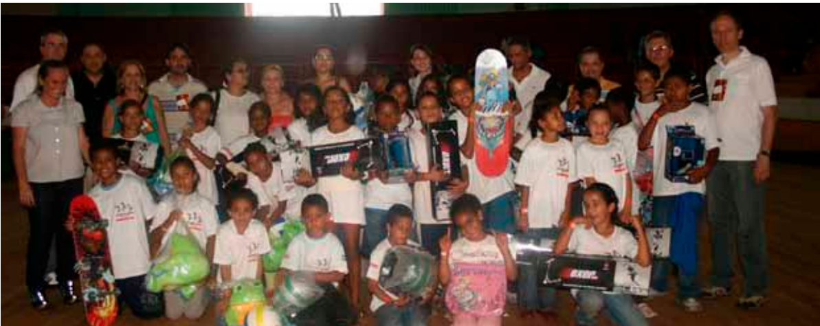
Durante o dia da entrega na Usina da Pedra, as crianças do Lar Santo Antônio, de Serrana, comparecem ao ginásio da Expocana e recebem das mãos de diretores e funcionários seus presentes de Natal

O projeto Papai Noel entregou brinquedos as para crianças de entidades apoiadas pela empresa, durante o evento em Serrana.