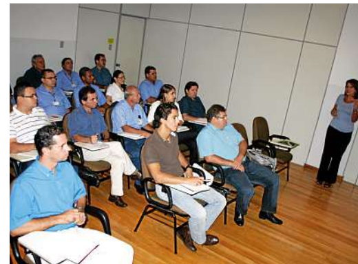
Funcionários que compõem o Comitê de Sustentabilidade

por uma equipe multidisciplinar, envolvendo funcionários de todas as unidades do grupo.