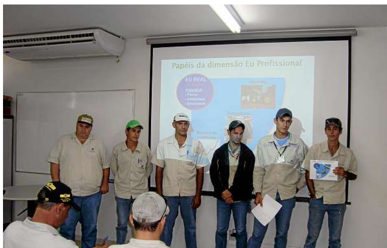
Dinâmica envolve funcionários na usina Buriti

Treinamento estimula o despertar de potencialidades