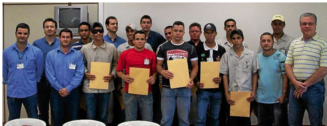
Formandos da Escola de Operadores de Máquinas Agrícolas e de Mecânico de Manutenção Agrícola

No dia 7 de dezembro de 2010, a Ipê também realizou a solenidade de formatura de 13 funcionários que concluíram o curso de Formação de Operadores de Máquinas Agrícolas e de 11 funcionários que concluíram o curso de Mecânico de Manutenção Agrícola. Para participar das escolas de formação do grupo Pedra, o funcionário faz sua inscrição, participa do processo seletivo e do programa de treinamentos desenvolvido pela empresa. //