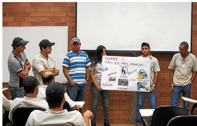
Na usina Ipê, participantes fazem apresentações

A equipe de Recursos Humanos vem desenvolvendo uma série de treinamentos com o objetivo de formar profissionais com habilidades técnicas e comportamentais, que atuem de acordo com as diretrizes estratégicas da empresa.