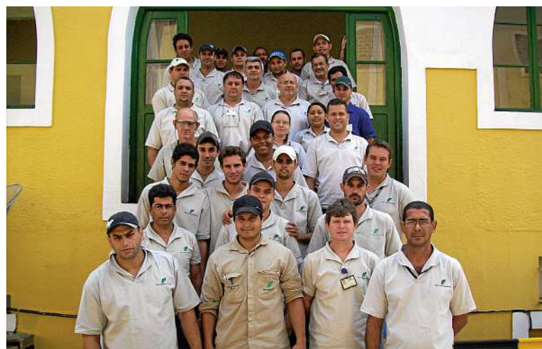
Grupo de funcionários que participaram do treinamento na usina Ibirá