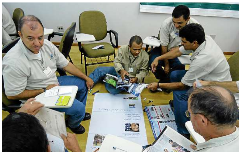
Grupo da usina da Pedra se reúne para discutir idéias durante treinamento