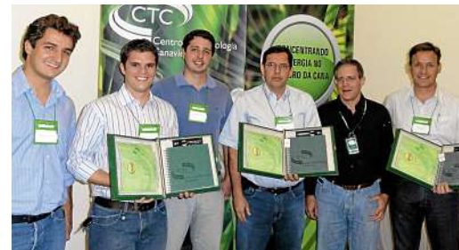
Homenagem recebida pelo CTC durante evento em Ribeirão Preto

experimentação definido pelo número de ensaios de campo conduzidos na associada e/ou elevada participação de variedades CTC no plantio (acima de 50%).