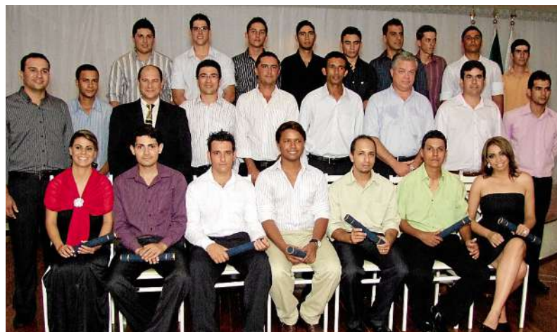
Formandos do curso técnico em Química

Dedicação e esforço são itens essenciais para quem quer se desenvolver profissionalmente. Para reconhecer o empenho dos funcionários, a Usina Ipê realizou entre dezembro de 2010 e fevereiro de 2011, a formatura dos estudantes de cursos técnicos e escolas de formação que foram capacitados pela empresa.