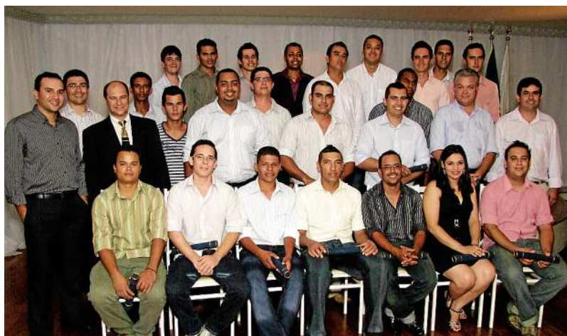
Formandos do curso técnico em Mecânica