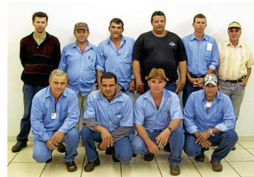
Líderes da Usina Buriti