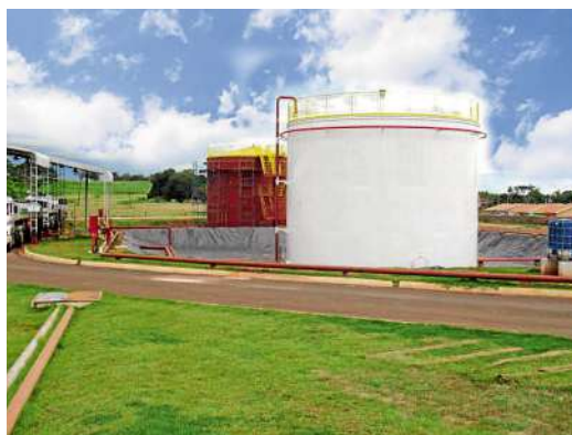
Tanque 01 da Pesa já está pronto, ao fundo tanque 02 em fase de acabamento

Está em fase final de construção. Os dois tanques de etanol na Pesa Logística Ltda, localizada em Andradina-SP. Com a construção dos dois tanques, que tiveram o início das obras em setembro de 2010, o sistema de carregamento, que é feito diretamente das carretas para os vagões, será otimizado. A partir da finalização das obras, as carretas vão descarregar o etanol nos tanques, que terão capacidade de 870 mil litros cada.