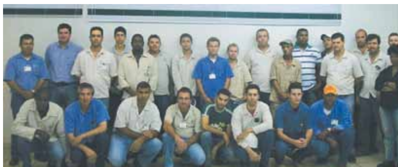
Posse da CIPA e CIPA TR na Usina Buriti