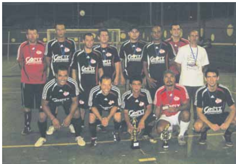
A Copa 80 na Usina da Pedra - Torneio de Futsal consagrou como Tri-Campeã a equipe da Manutenção Industrial. Em segundo lugar, Ajax (Turma 12) e, em terceiro, União Industrial.