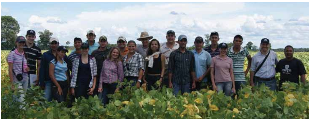
Alunos da UNEMAT durante visita na Carpa

vantagem da Universidade aqui no Mato Grosso é que tudo aquilo que se discute em sala de aula, pode ser visto com muita facilidade no dia-a-dia do campo, com fácil acesso, contando com a tecnologia de ponta e inovadora, como é o caso da Agricultura de Precisão em áreas de pecuária. //