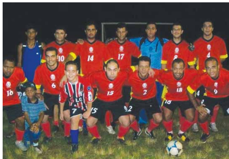
Na Usina Ibirá, a equipe Choque 3D sagrou-se campeã. Em segundo lugar, Operadores de Cajuru e, em terceiro, Laboratório.