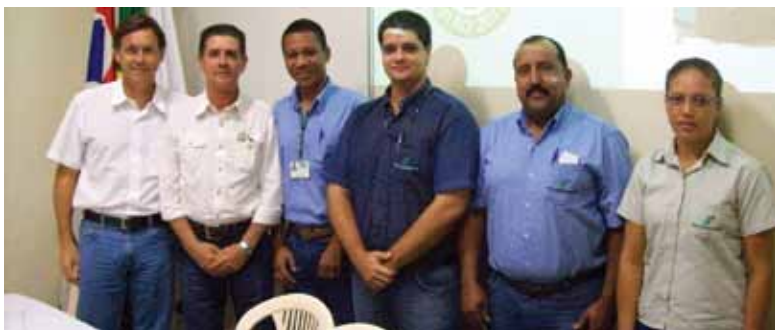
Representantes da CIPA e CIPA TR da Usina Ipê

A relação completa dos eleitos entre representantes e suplentes foi divulgada nos murais Fique Informado. ”