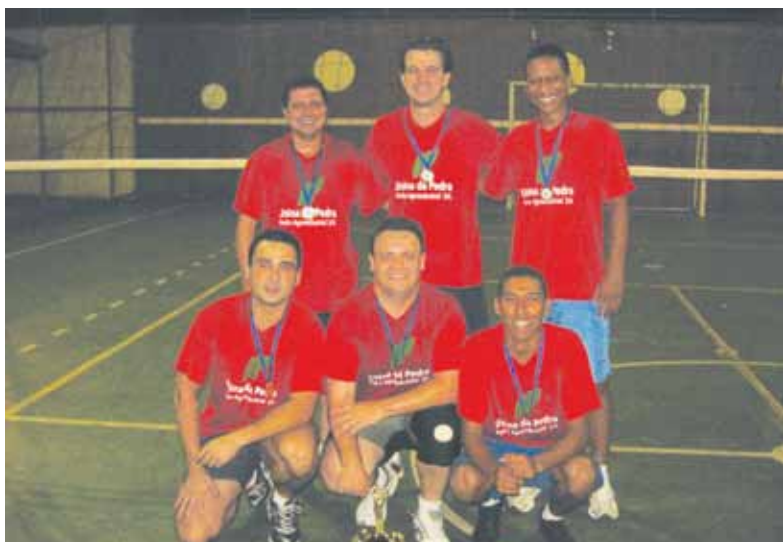
No Torneio de Vôlei da Usina da Pedra a grande campeã foi a equipe do DRH. Em segundo e terceiro lugar, Administração Andar Superior e Indústria, respectivamente.