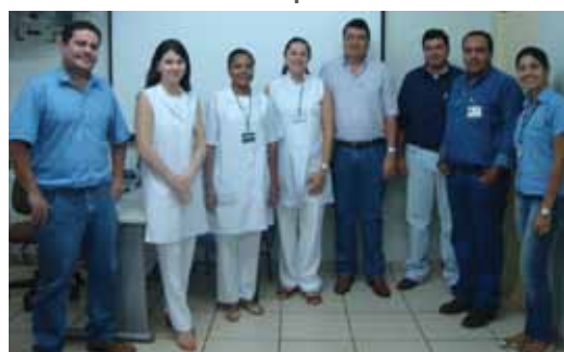
Equipe responsável pelo programa de saúde

O Programa de Educação Nutricional da Usina Buriti está incentivando os funcionários a melhorarem sua qualidade de vida