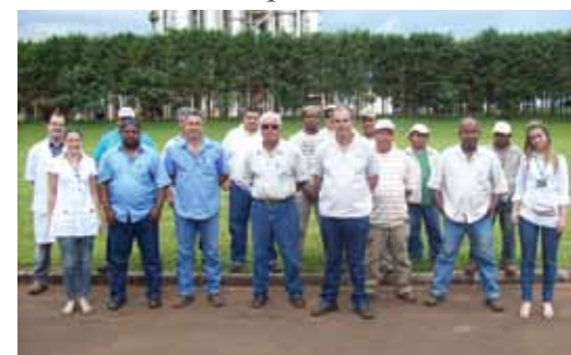
Participantes do Programa de Educação Nutricional

do programa, foram selecionados os funcionários que possuíam IMC – Índice de Massa Corpórea acima do recomendado e hipertensão. //