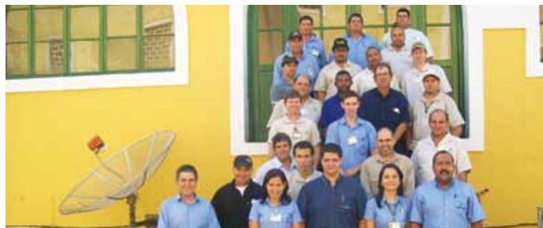
Posse na Usina Ibirá