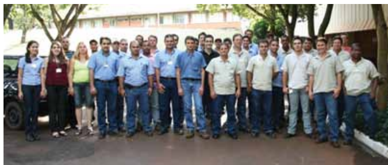
Cerimônia de posse na Usina da Pedra