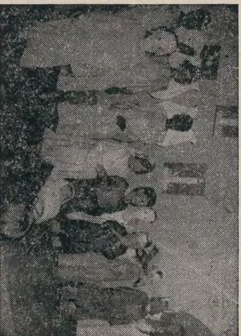
"Presépio Vivo" apresentado pelas crianças da Fazenda

PARA EVITAR A DESIDRATAÇÃO É IMPORTANTE CUIDAR DA HIGIENE DOS ALIMENTOS E DA ÁGUA.