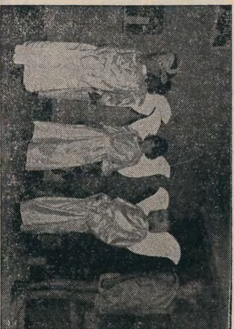
NATAL COMUNITARIO NA FAZENDA TRANSWAAL CENA DO “PRESEPIO VIVO” APRESENTADO PELAS CRIANÇAS