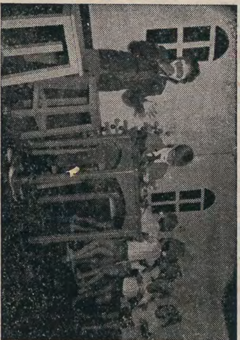
Natal Comunitário na A.P.S. — Teatro apresentado pelas crianças de Serrana "Os dois velhos e os sete anões"