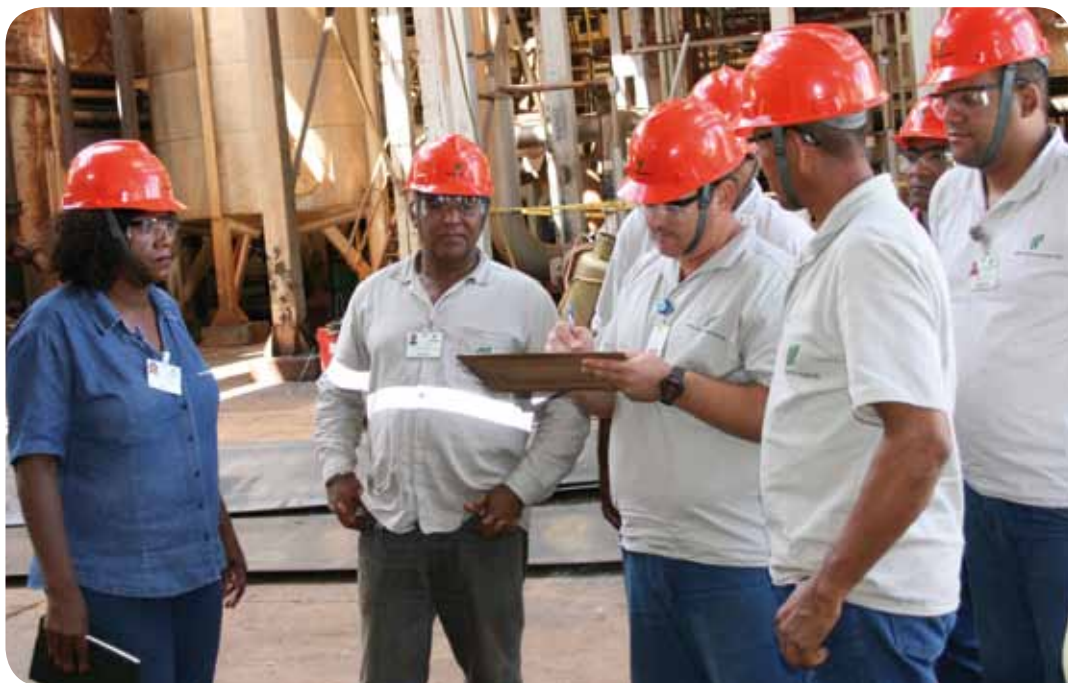
Funcionários da indústria participam de treinamento prático

Com um formato diferente treinamento aborda, na prática, o sistema de gestão da qualidade