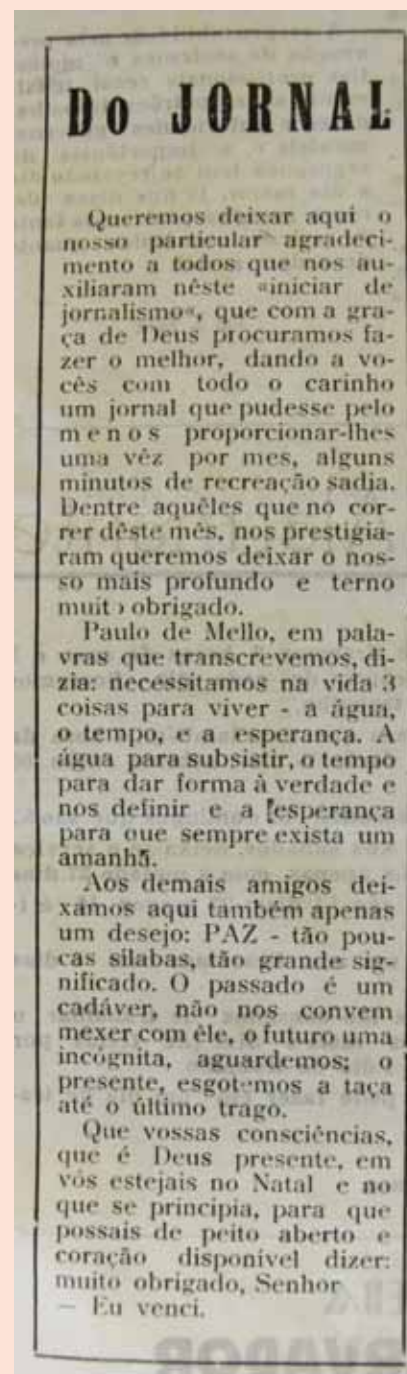
Reprodução do texto de agradecimento da primeira edição do jornal Observador, de dezembro de 1970

os funcionários das quatro unidades produtoras do grupo, além de fornecedores, parceiros e órgãos públicos. O jornal também pode ser visto e baixado no site da empresa, www.pedraagroindustrial.com.br