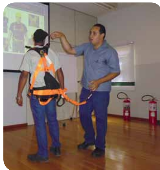
Os treinamentos contam com demonstrações práticas

Esperamos com isso que cada funcionário em seu posto de trabalho tenha atitudes preventivas, garantindo assim que os resultados sejam sem intercorrências, concluiu Gusmão.//