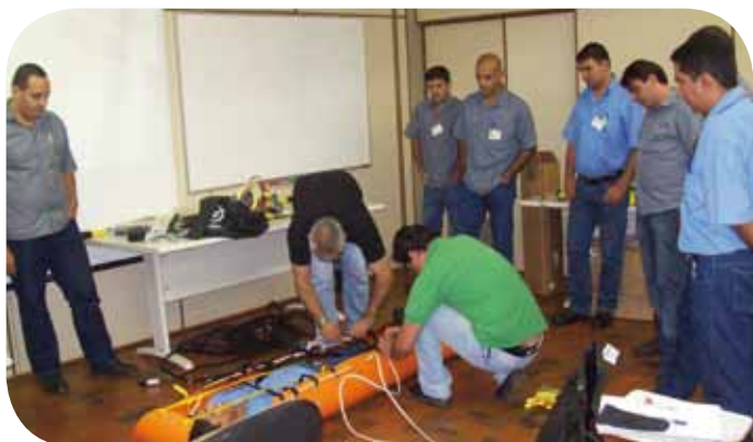
Treinamento de saúde e segurança