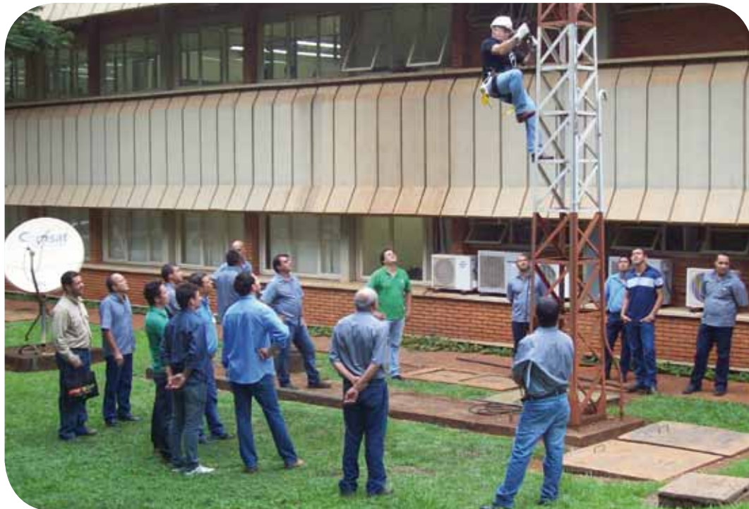
Treinamento de segurança realizado na Usina da Pedra

Equipes treinadas e motivadas para fazer a diferença