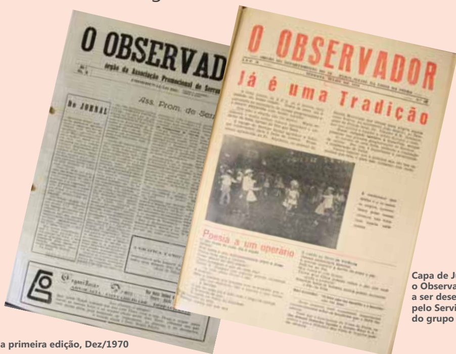
Capa da primeira edição, Dez/1970

Jornal Observador atinge marca histórica