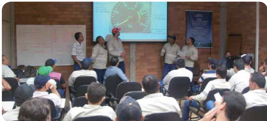
Funcionários da Usina Ipê durante treinamento preparatório para safra

A qualificação dos funcionários sempre foi prioridade na Pedra Agroindustrial e devido ao aprimoramento do plantio de cana, assim como as safras cada vez mais longas, não é mais possível a sua realização unicamente no período de entressafra, sendo necessário a adequação dos programas e cronogramas de desenvolvimento de pessoas para todo o ano.