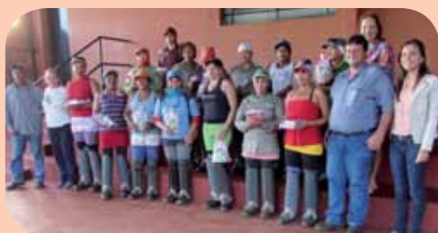
Funcionárias da Agrícola, na Usina da Pedra

O eSocial é um projeto do governo federal que vai unificar o envio de informações pelo empregador em relação aos seus empregados. A unificação se dará através da integração dos sistemas informatizados das empresas com o ambiente e-social do governo federal, viabilizando a automação na transmissão das informações dos funcionários via internet.