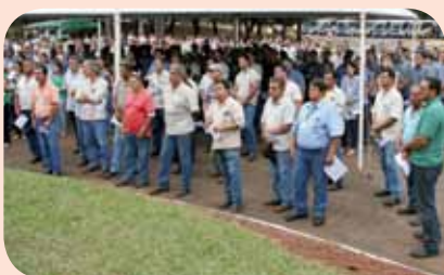
Benção de safra da Usina da Pedra