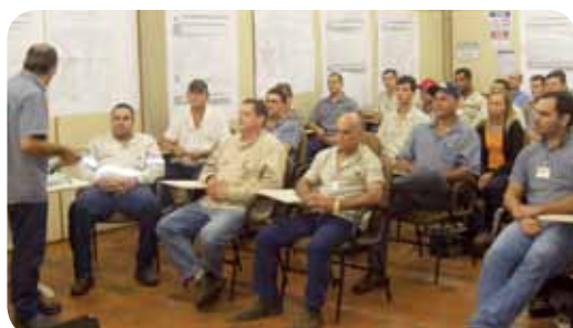
Treinamentos para safra também acontecem na Usina da Pedra