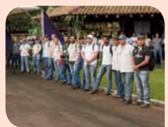
Funcionários da Usina Buriti durante a benção de safra