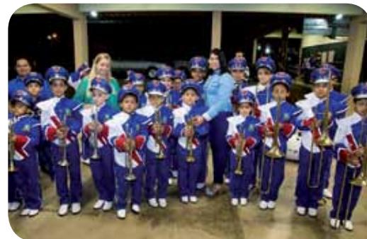
Banda de Nova Independência foi uma das beneficiadas

Buritizal também recebeu aportes para os projetos de Natação e Dançar é Vida. Em Aramina, o investimento