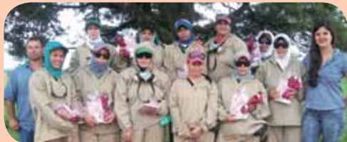
Algumas funcionárias da Agrícola, na Usina Ipê