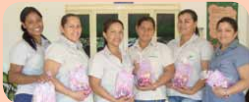
Área Administrativa da Usina Buriti