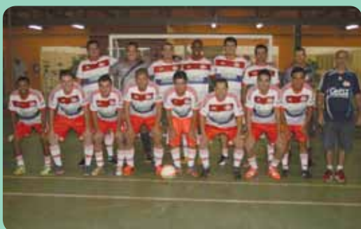
Na Usina da Pedra, o time Manutenção Industrial foi Tetracampeão!

Os tradicionais campeonatos de entressafra agitam as unidades. Os funcionários reuniram familiares e amigos na torcida pelo título de campeão. Na Usina da Pedra, o time Manutenção Industrial conquistou o tetracampeonato. Na Buriti, o primeiro lugar ficou com o time MM Montagem e na Ipê, a equipe Divisão Industrial foi a grande campeã. Confira abaixo, as fotos dos vencedores.//