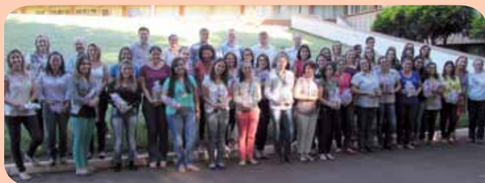
Usina da Pedra

Um incentivo à leitura. Foi com essa proposta que o Projeto Mulher 2015 aconteceu em todas as unidades da empresa no mês de março. As funcionárias receberam o livro "Mulheres Inteligentes, Relações Saudáveis", do escritor Augusto Cury. Nele, o autor exemplifica diversas relações saudáveis que envolvem vida profissional, social e familiar, temas que cultivam a transformação de pontos fracos em pontos fortes e que também fazem parte do universo masculino, por isso, o livro pode ser lido por todas as pessoas. O Projeto Mulher é realizado há mais de 10 anos pela Pedra Agroindustrial, abordando a valorização, desenvolvimento e saúde das mulheres, diretrizes que estão de acordo com as propostas da Abrinq, fundação que reconhece a empresa como amiga das crianças e adolescentes.