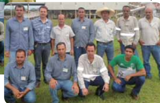
Membros da CIPATR da Usina Ipê