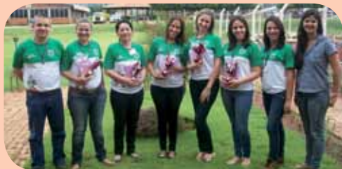
Área Administrativa da Usina Ipê