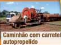
Caminhão com carretel autopropelido

Via caminhões-tanque: o caminhão transporta a vinhaça de um ponto de carregamento até o campo onde é acoplado a um carretel autopropelido.