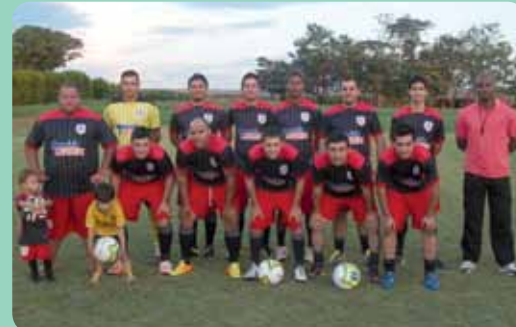
O time Divisão Industrial venceu o campeonato da Usina Ipê