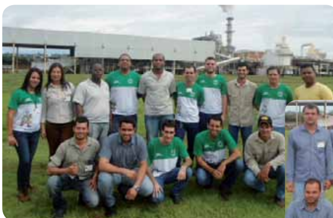
CIPA da Usina Ipê