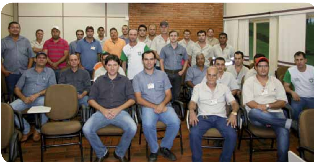
CIPA e CIPATR da Usina da Pedra