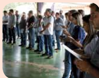
Benção de safra da Usina Buriti