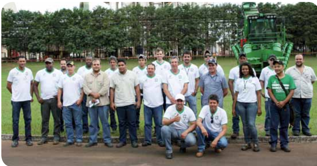
Equipes da CIPA e CIPATR da Usina Buriti

Conheça nas fotos as diretorias e equipes das três unidades.//