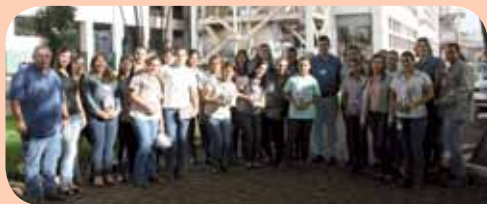
Usina da Pedra : Equipe da Indústria