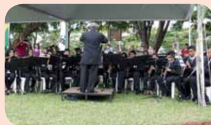
Banda Sinfônica de Serra Azul durante apresentação na Benção de safra da Usina da Pedra