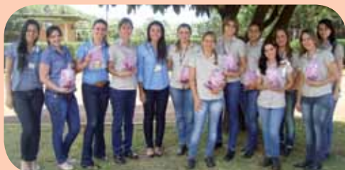
Indústria e Administrativo da Usina Buriti