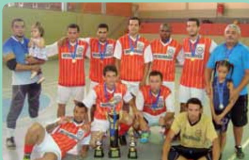
Na Usina Buriti, o time campeão foi o MM Montagem