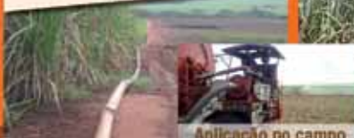
Aplicação no campo