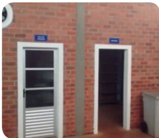
Salas separadas: melhor condição de armazenagem

Mais segurança patrimonial, ambiental e pessoal para a unidade