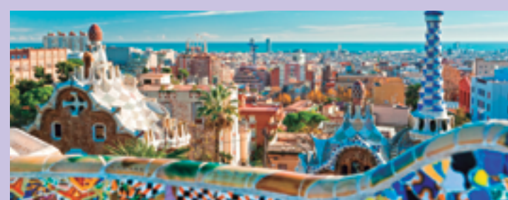
Vista de Barcelona

Centro intelectual e político de um vasto império, pilar da fé católica e foco das artes. A Europa possui um cenário gastronômico vibrante. Shows, espetáculos e exposições também são algumas das atrações à parte da agitada vida cultural no velho mundo. Uma viagem inesquecível!