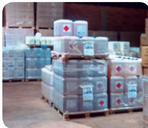
Armazenagem de defensivos

A nova Central de Defensivos da Usina Ipê é uma solução que proporciona mais qualidade e agilidade, prioriza a segurança ambiental, prevenção de acidentes e confiabilidade na armazenagem e preparação de agroquímicos.