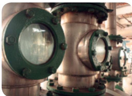
Destilarias da Pedra Agroindustrial: tecnologias que impedem danos ao meio ambiente

A importância do etanol para a qualidade do ar