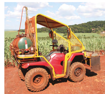
Quadriciclo para aplicação de defensivos

No dia 02/05, os executivos da fabricante de veículos Honda, realizaram uma visita à Usina da Pedra e tiveram a oportunidade de conhecer todo processo agrícola e industrial para a produção do açúcar, etanol e cogeração de energia. Um ponto alto da visita foi a surpresa dos executivos ao verificar que hoje o processo agrícola é otimizado pelo uso de quadriciclos da Honda customizados para a aplicação de defensivos agrícolas, um diferencial da Pedra Agroindustrial. //