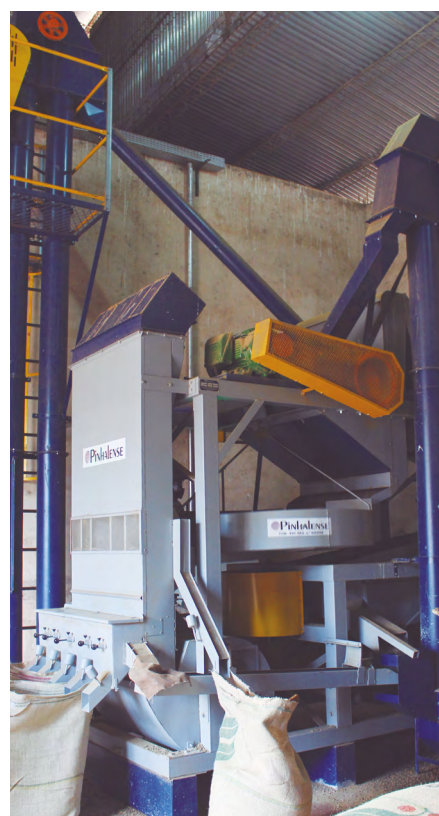
Máquina de benefício