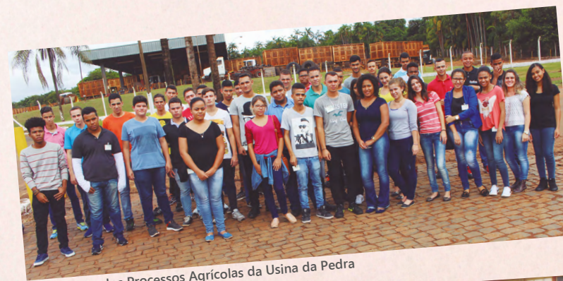
Aprendizes dos Processos Agrícolas da Usina da Pedra

"Meu filho está maravilhado e nós também. Ele começou há pouco tempo e já teve diversas oportunidades, inclusive tudo que tem aprendido no curso Jovem Agricultor do Futuro em Serra Azul está implantando dentro de casa. Já temos aqui também a nossa hortinha! Fico muito feliz com a oportunidade e com o comprometimento dele", ressaltou a mãe do Jovem