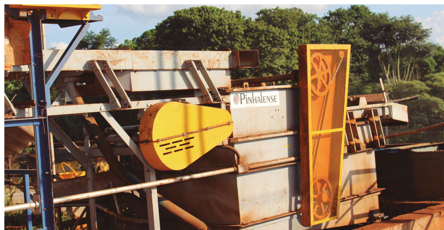
Lavagem do café