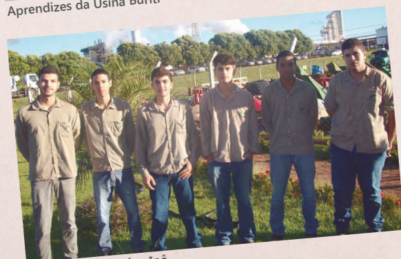
Aprendizes da Usina Ipê