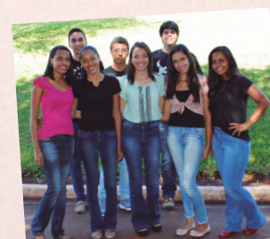
Aprendizes que atuam na área administrativa da Usina da Pedra