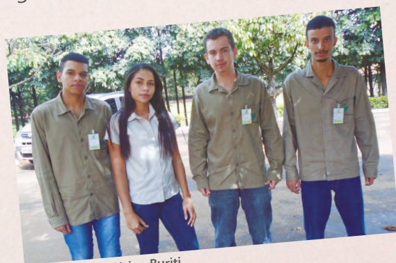
Aprendizes da Usina Buriti

Aberto para jovens, com idade entre 14 e 24 anos, o programa proporciona oportunidade para o primeiro emprego aos que procuram um curso de qualificação profissional tendo não apenas a experiência prática, mas também capacitação teórica adequada. Além dos aprendizes que já atuam na Pedra Agroindustrial, o grupo está admitindo jovens para as três unidades: Na Usina da Pedra foram admitidos 84 aprendizes e, no segundo semestre, estão previstas outras contratações para as unidades Buriti e Ipê. Fique atento às oportunidades e para mais informações, procure o DRH de sua unidade. //