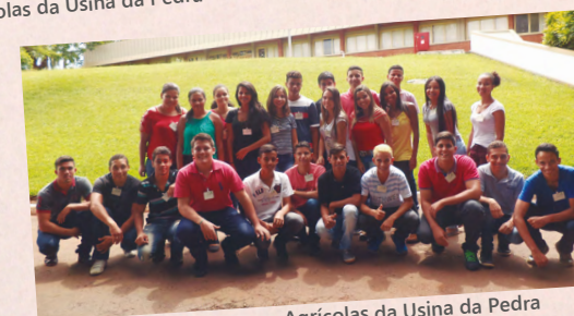
Aprendizes dos Processos Agrícolas da Usina da Pedra