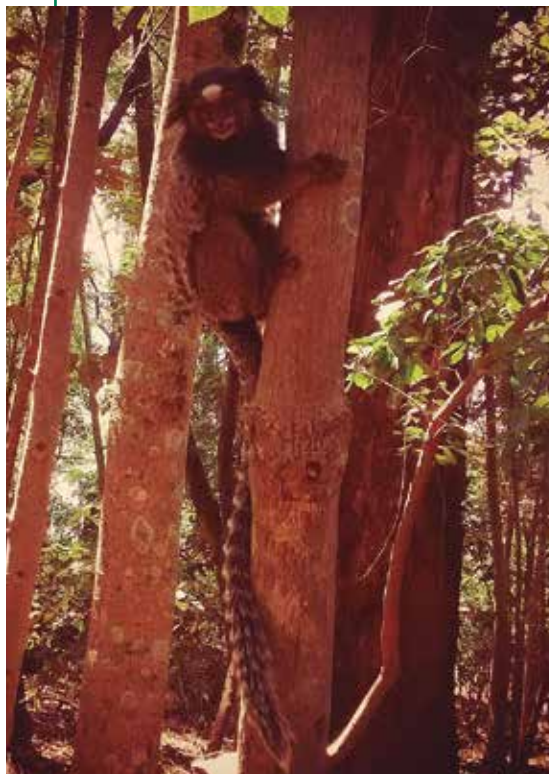
Sagui na Usina da Pedra.