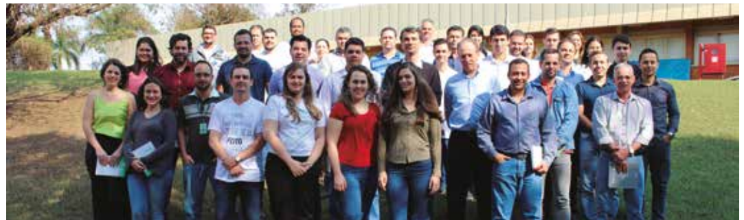
Equipe responsável pela implantação do SAP.

O projeto possui cinco fases (Preparação inicial; Realização; Testes Integrados; Transição e Go live). Atu-