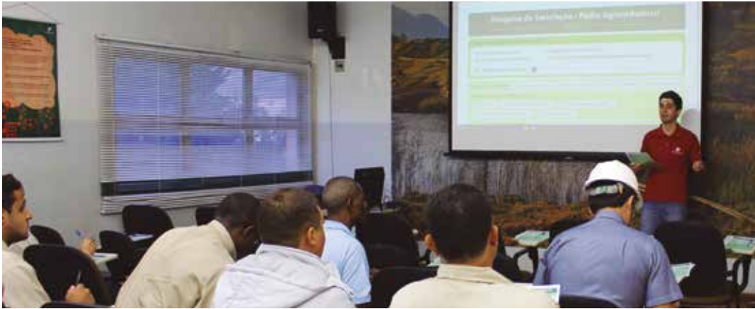
Aplicação da Pesquisa de Clima Organizacional nas unidades.

Com o objetivo de tornar o ambiente de trabalho cada vez melhor, desde setembro, a Pedra Agroindustrial realiza em suas três unidades uma Pesquisa de Clima Organizacional. O Projeto deve contemplar todos os funcionários,