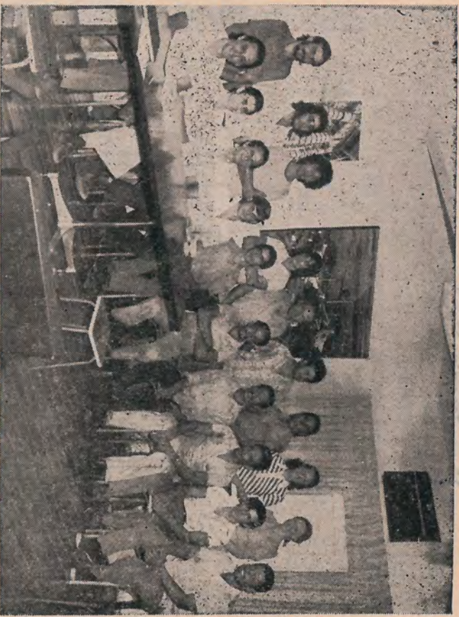
ASPECTO DA TOMADA DE POSSE DA VII DIRETORIA DA C.I.P.A.