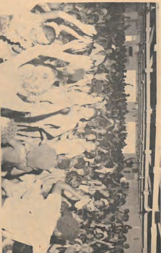
Aspectos do Carnaval em nossa sede