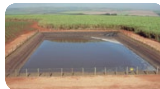
Represa de vinhaça

Redes de distribuição recebem melhorias visando aumento na segurança operacional e ambiental