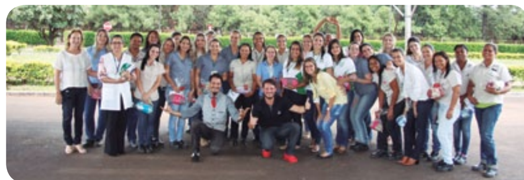
Projeto Mulher na Usina Buriti