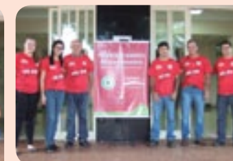
Parte da comissão organizadora do evento na Usina da Pedra