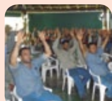
Palestra e descontração!