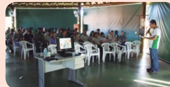
Funcionários reunidos no Quiosque da Usina Buriti