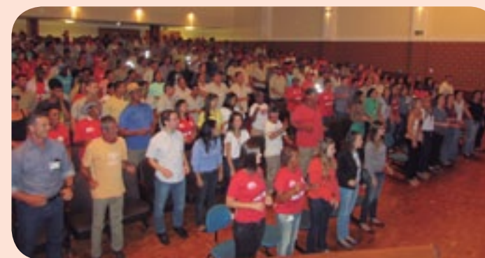
Auditório lotado durante a SIPAT da Usina da Pedra