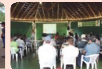
Grande participação de funcionários nas palestras