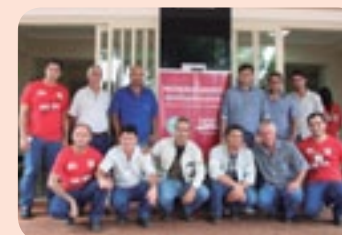
Funcionários: unidos pela segurança