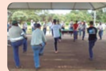
Ginástica laboral foi um dos temas