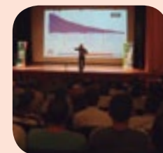
Ângelo Otávio durante apresentação em Serrana