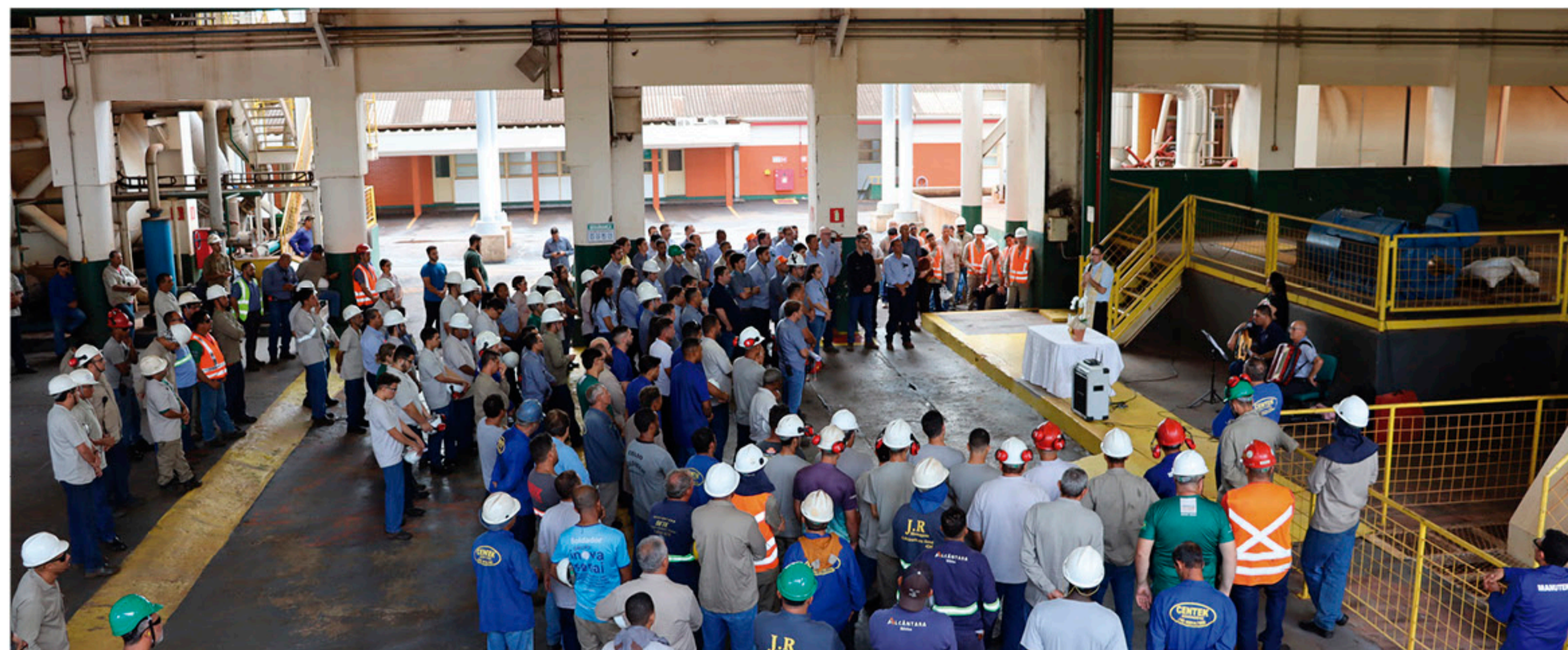
A cerimônia de Fim de Safra na Usina da Pedra foi realizada no dia 02/12, acima, funcionários e prestadores de serviços da Indústria durante a celebração na moenda.