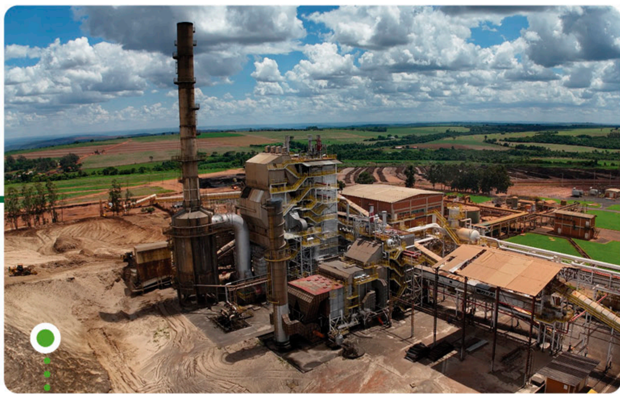
Caldeira da Usina Buriti

A distribuição de energia elétrica cogerada pela Pedra Agroindustrial para a rede que chega à sociedade é realizada por concessionárias de distribuição, impactando diretamente cerca de 300 mil pessoas por ano.