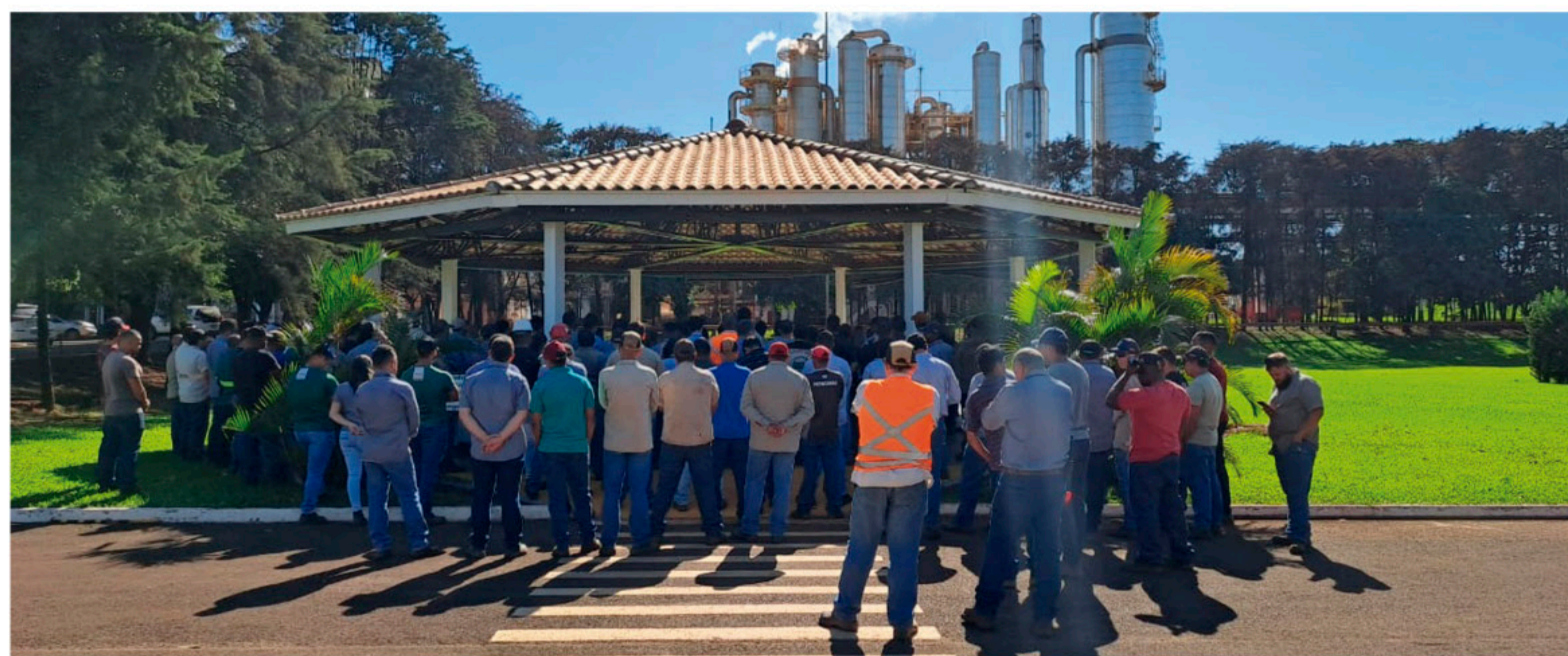
Funcionários se reuniram para a Bênção de Fim de Safra da Usina Buriti no dia 27/11.