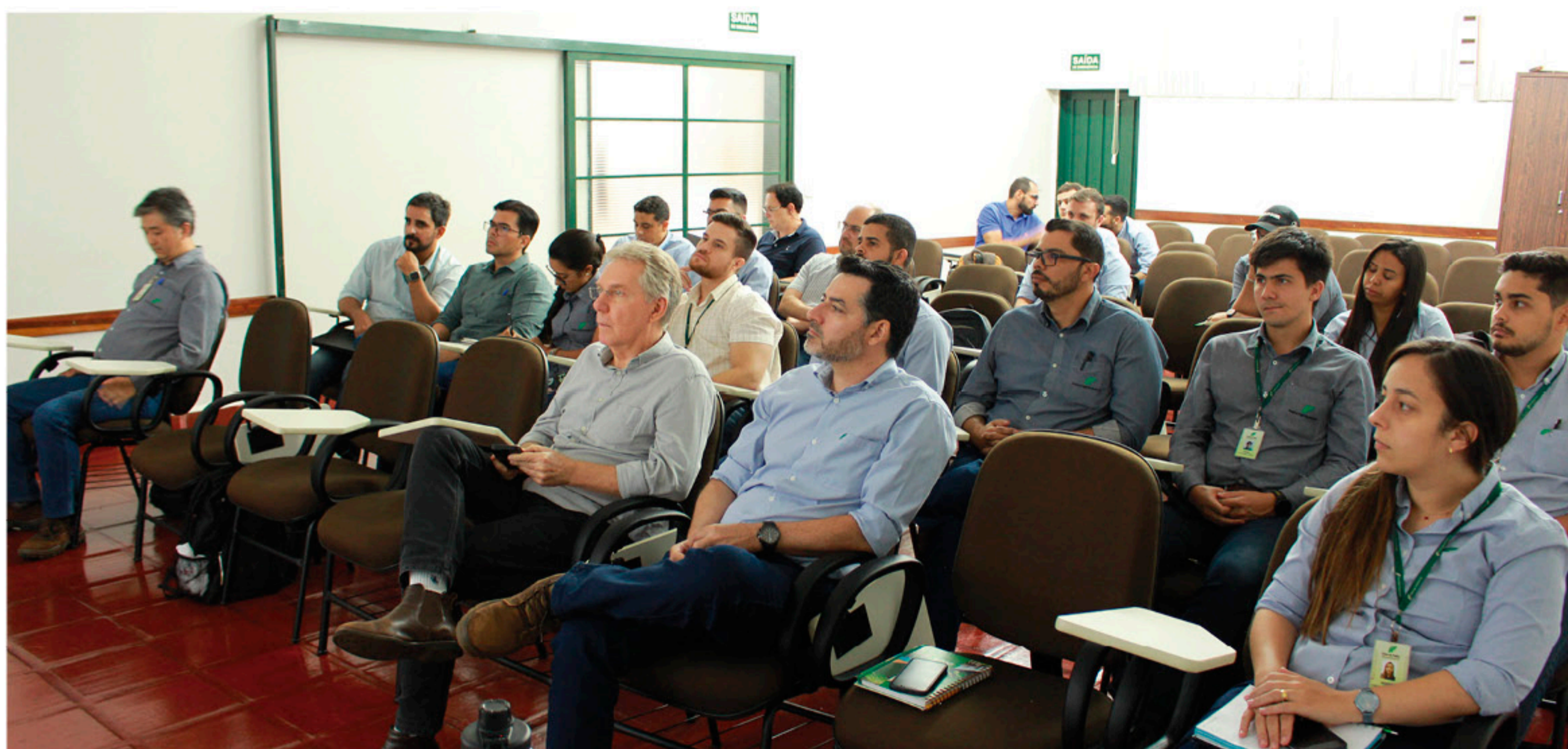
3ª edição do Comitê Técnico Agrônômico reuniu os profissionais da empresa que conheceram experimentações realizadas nas unidades da Pedra Agroindustrial.

Os resultados dos experimentos são importantes para a tomada de decisão na Pedra Agroindustrial, pois geram conhecimento técnico para adoção de novos manejos que aumentem a produtividade do canavial. Durante o comitê, também foi realizado um alinhamento sobre a condução dos experimentos na Pedra Agroindustrial no ano de 2025, assim como uma padronização da maneira de montar os experimentos. O Departamento de Orçamentos e Custos apresentou um modelo de planilha para avaliação da viabilidade econômica dos experimentos do grupo. 🌱