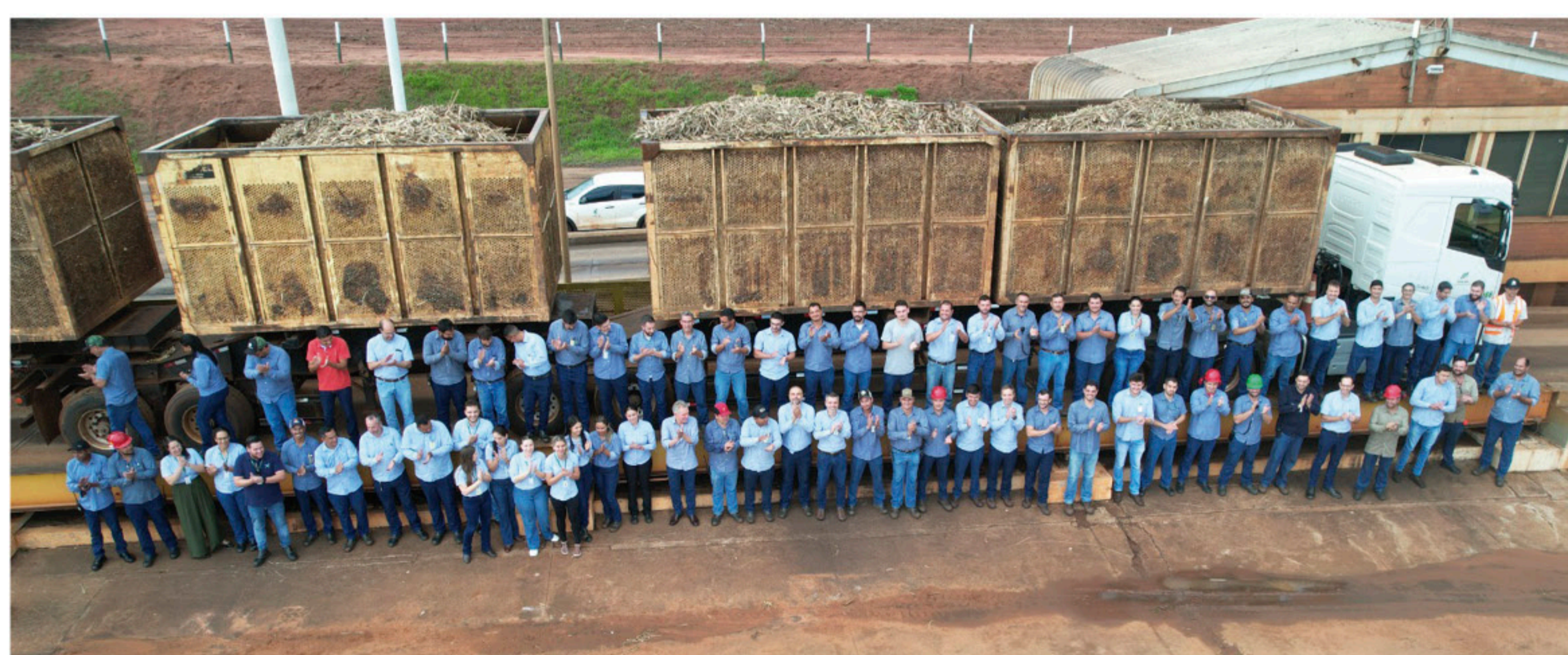
A Usina Ipê recebeu o último caminhão da safra no dia 03/12.