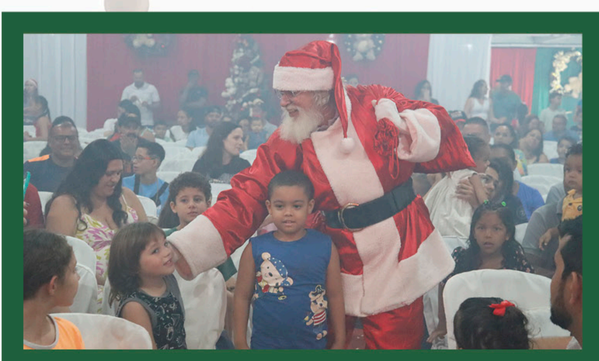
Papai Noel e as crianças durante entrega de presentes de Natal na Usina Buriti.