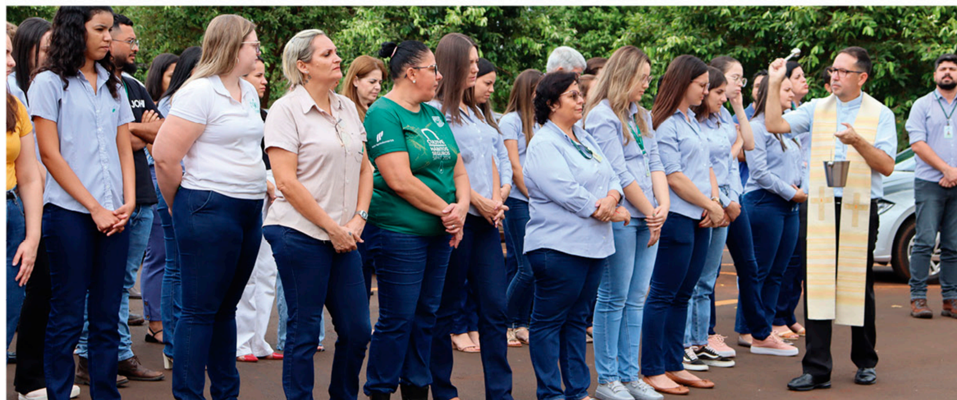
Momento da asperção durante a Bênção de Fim de Safra na Usina da Pedra.