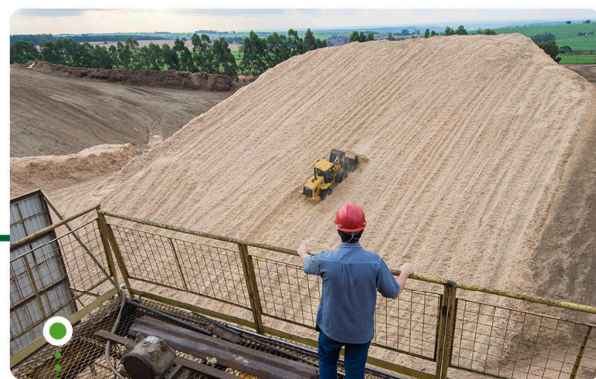
"Montanha" de bagaço