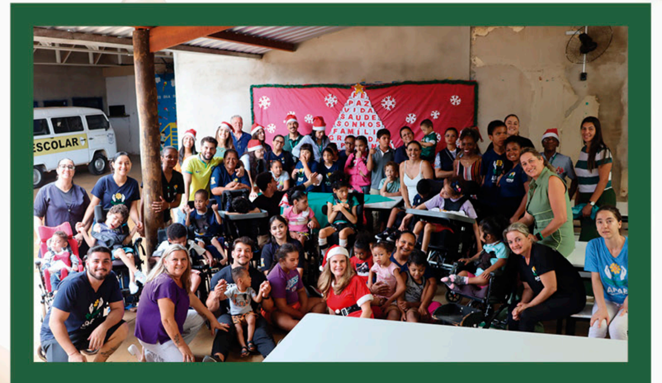
Em dezembro, funcionários da Usina da Pedra realizaram a entrega de presentes na APAE de Serrana/SP.