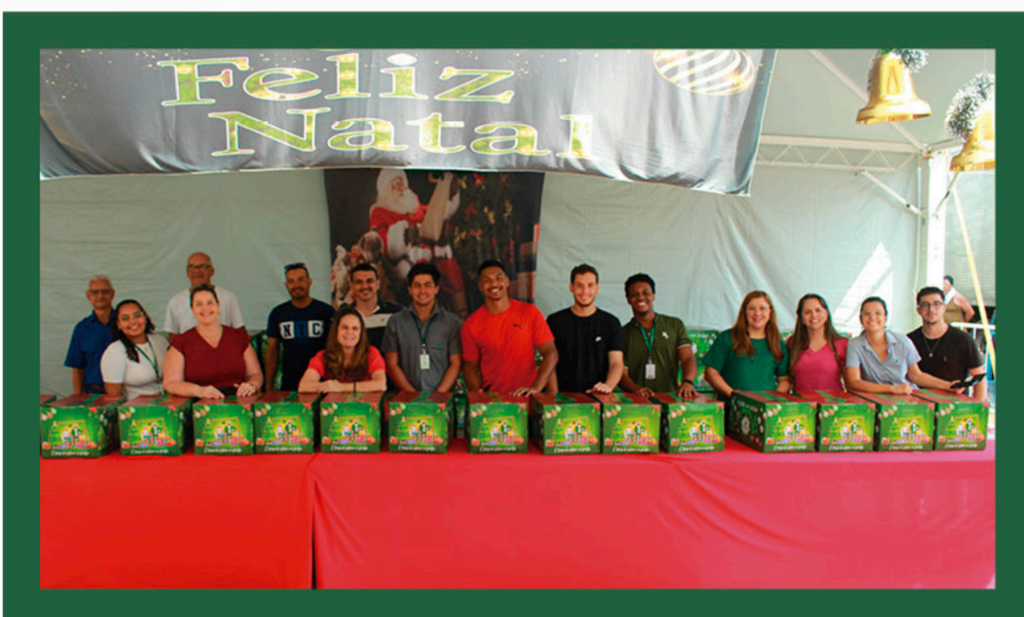
Equipe da Usina da Pedra na entrega de cestas de Natal.