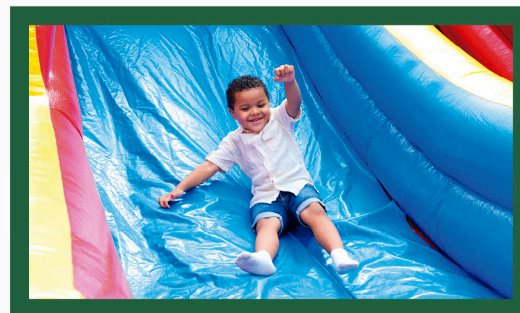
Programa Papai Noel também teve diversão com brinquedos para as crianças em todas as unidades.