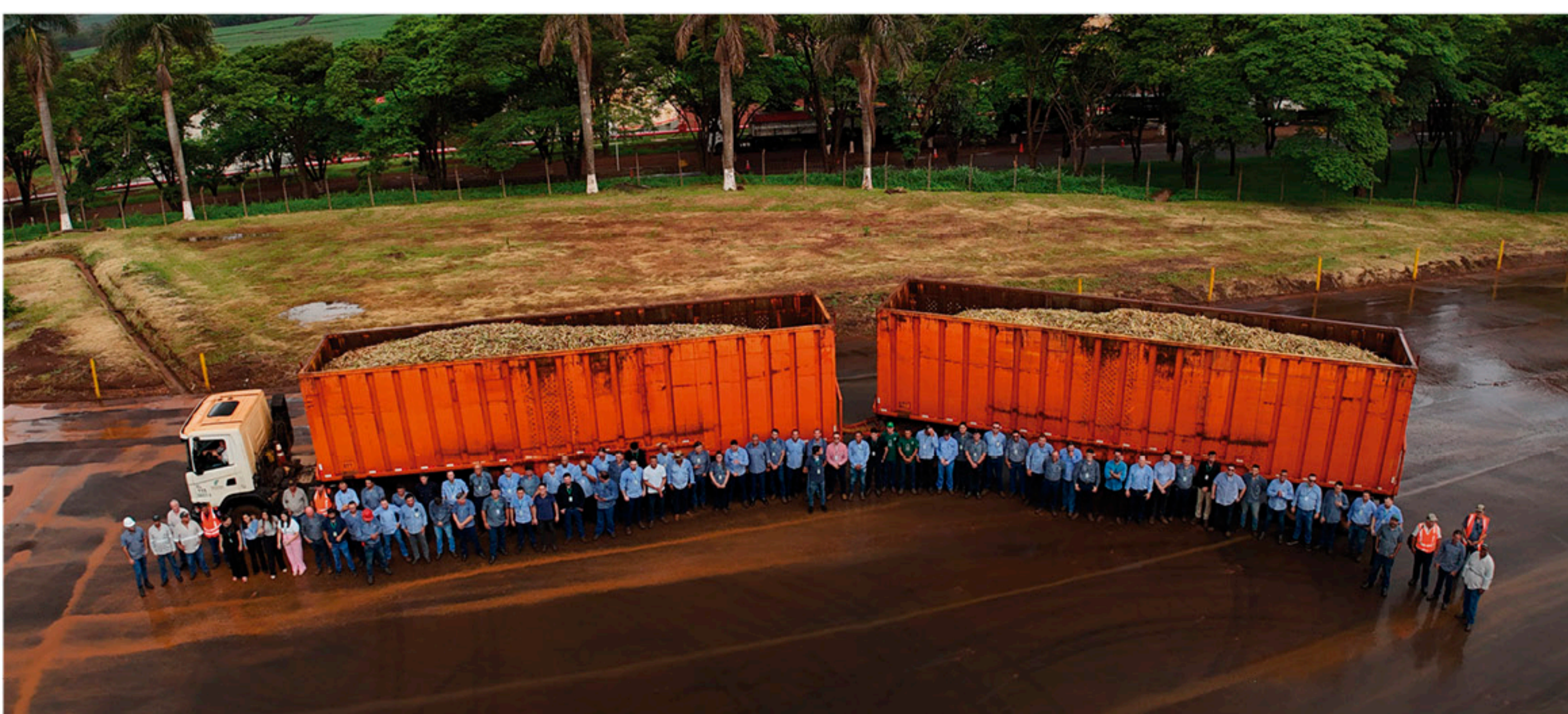
A Usina da Pedra recebeu o último caminhão encerrando a sua safra no dia 29/11.