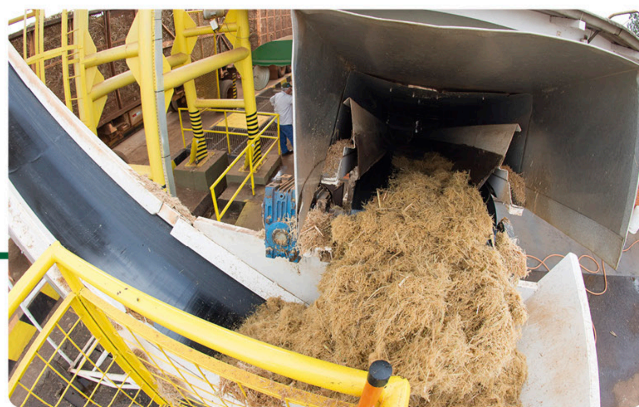
Esteira de bagaço

Tudo começa com o processamento da cana-de-açúcar, transportada até os parques industriais. Após a moagem e extração do caldo, é obtido o subproduto bagaço que é utilizado para a cogeração de energia elétrica.