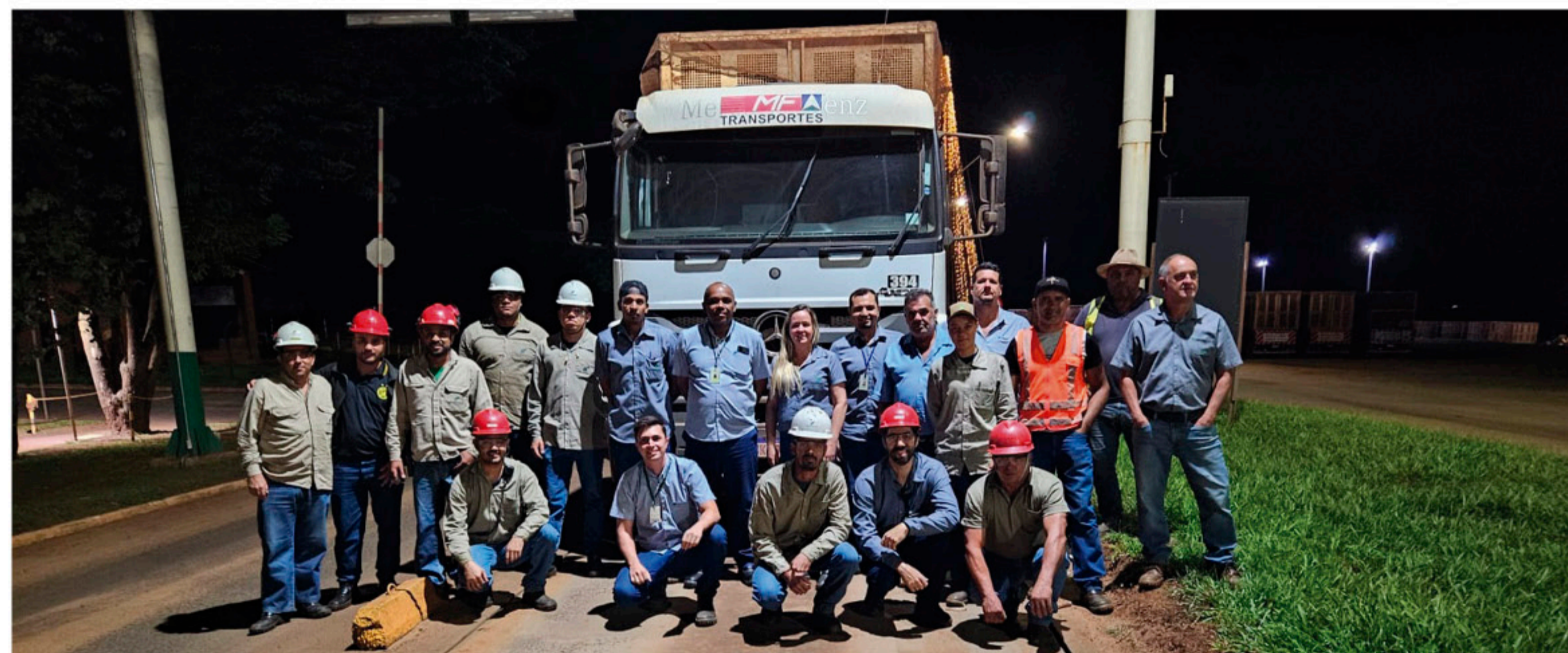
Último caminhão da safra da Usina Buriti foi recebido na balança no dia 27/11.