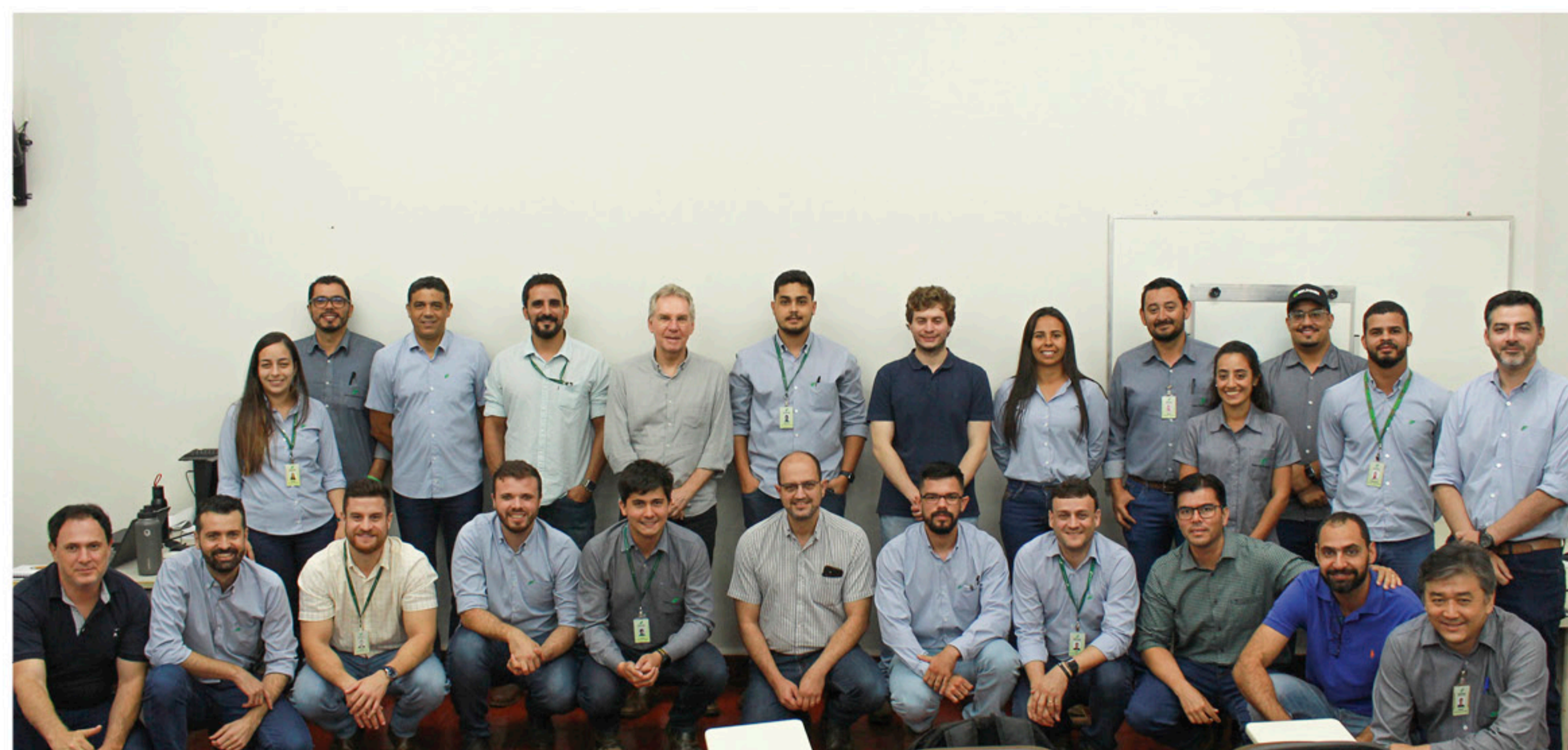
Profissionais dos departamentos Agrícola, Logística e Desempenho de Frota e do Departamento Técnico Agrônômico da Pedra Agroindustrial