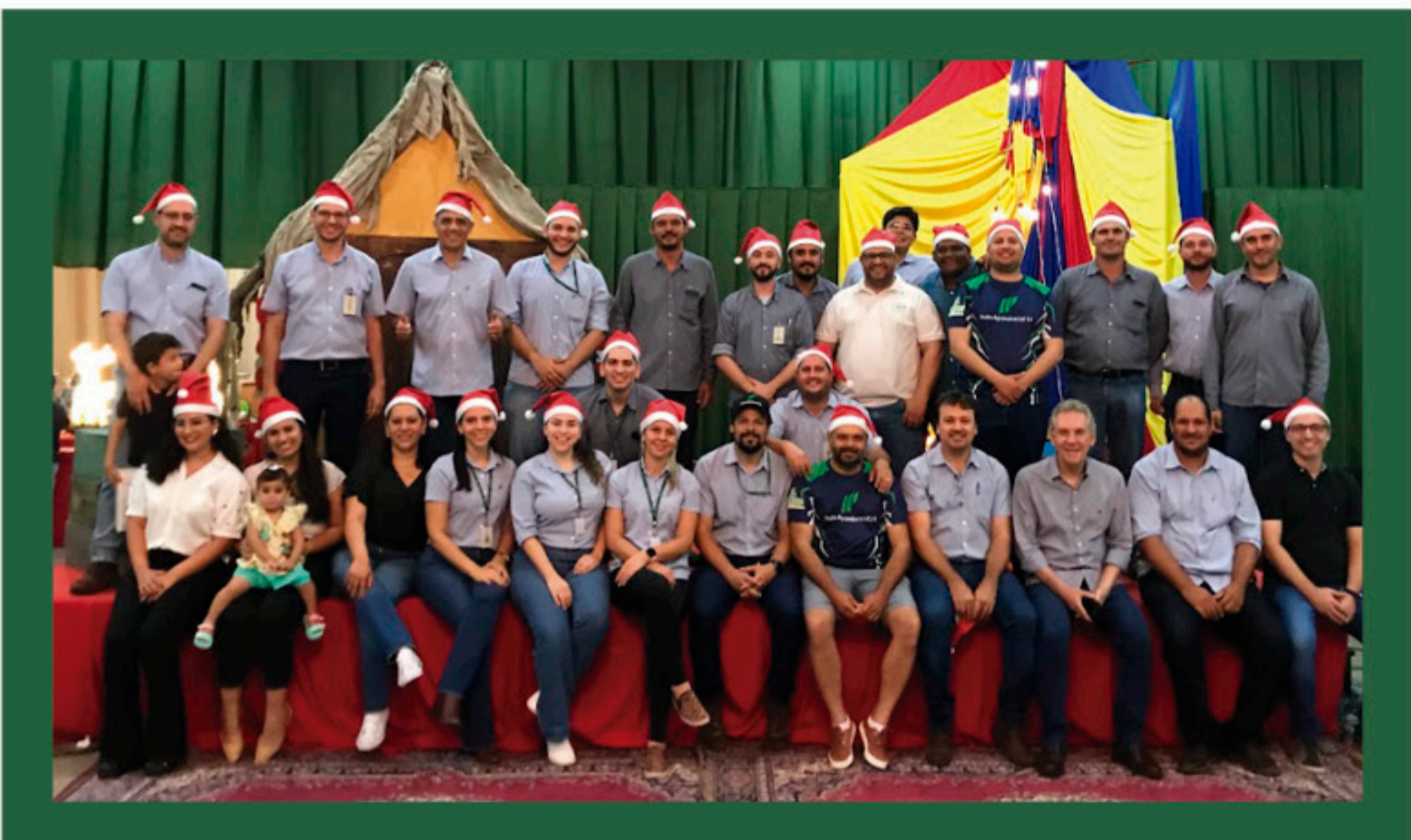
Equipe da Usina Ipê envolvida na entrega de presentes de Natal realizada no dia 03/12, em Andradina/SP.