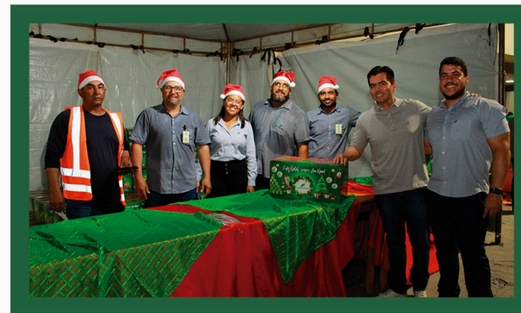
Equipe da Usina Cedro na entrega de cestas de Natal durante o Programa Papai Noel na Pedra Agroindustrial.