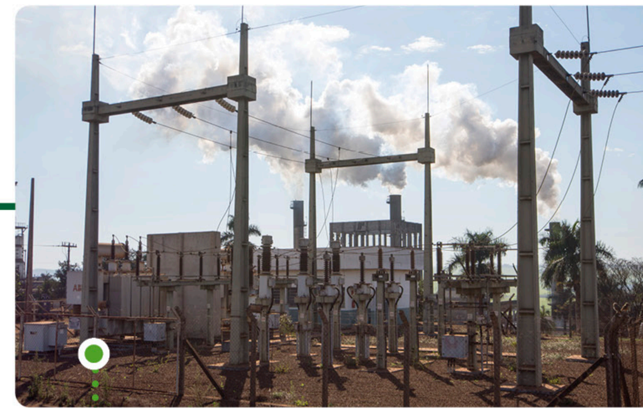
Subestação de energia elétrica na Usina da Pedra