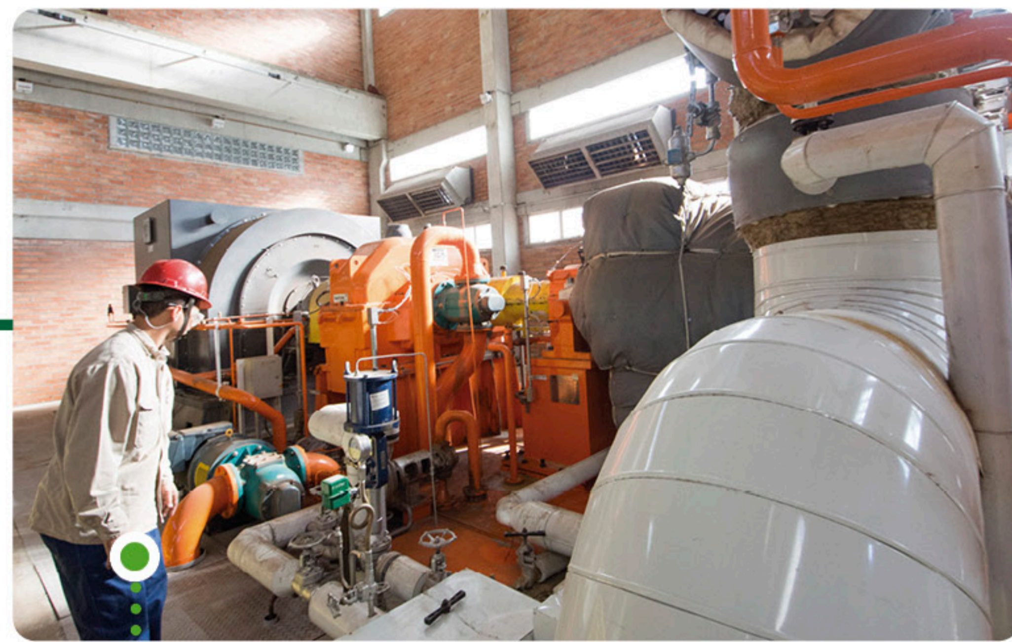
Turbogerador na Usina Ipê