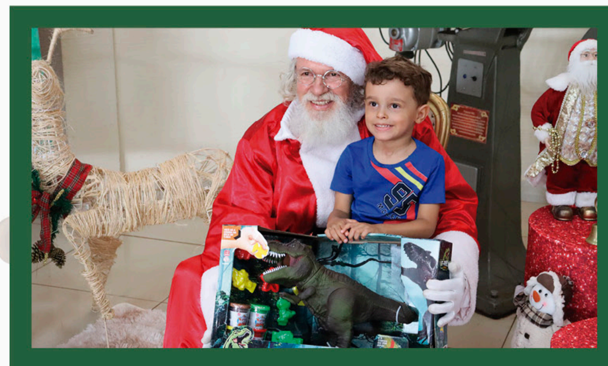
Papai Noel marcou presença na entrega de presentes de Natal nas unidades da Pedra Agroindustrial.