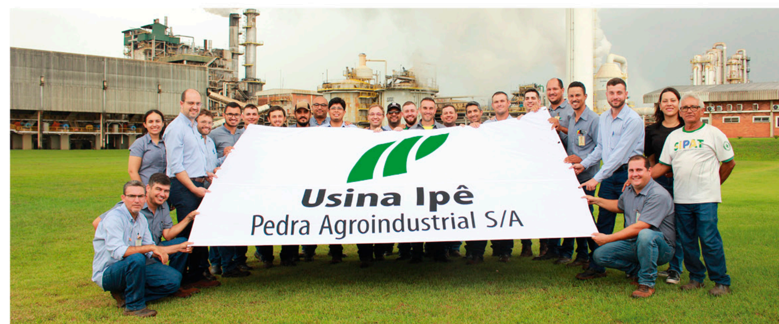
Momento de integração e comemoração unindo funcionários das Divisões Agrícola, Industrial e Administrativa da Usina Ipê após a Bênção de Fim de Safra.