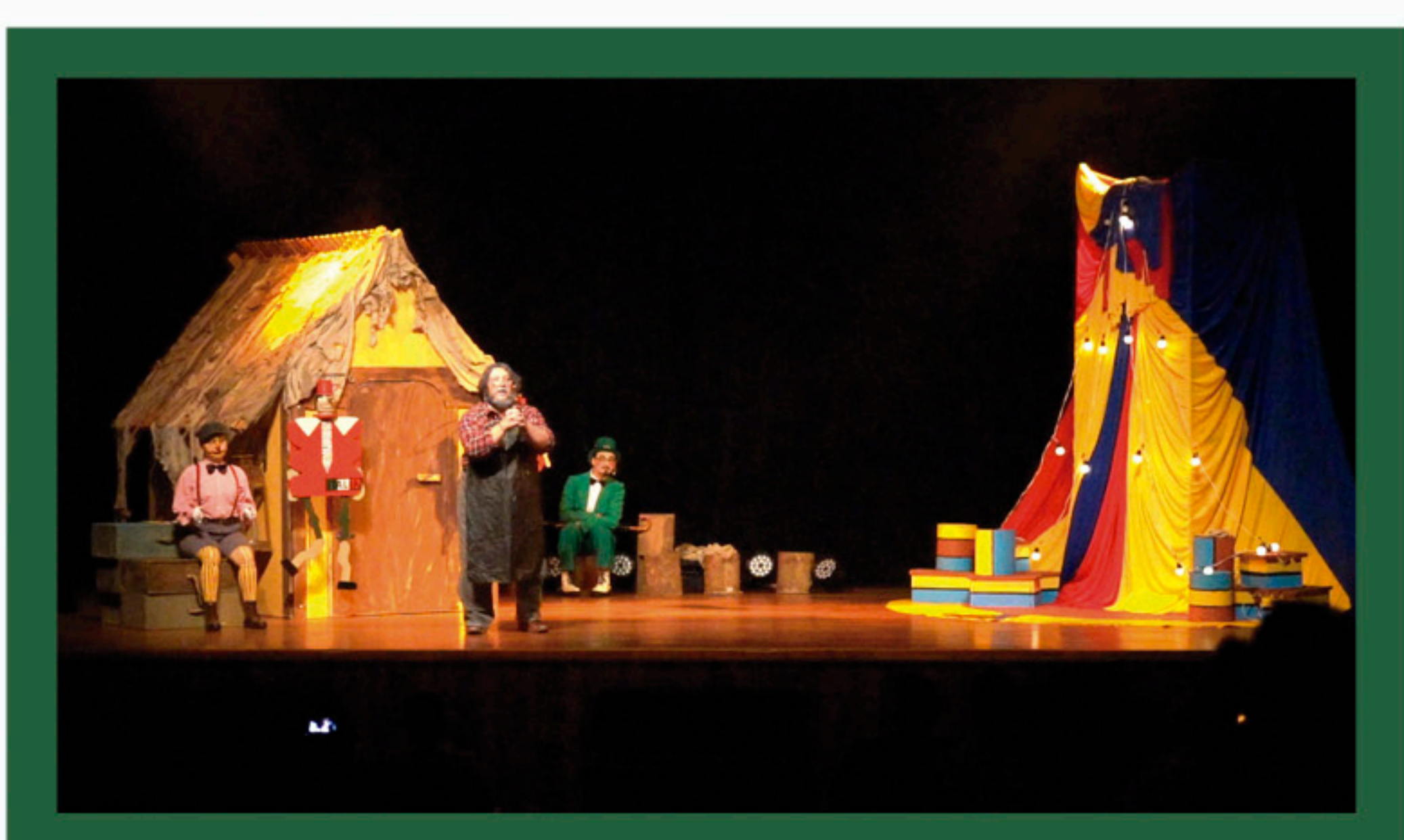
As crianças que participaram do Programa Papai Noel nas unidades da Pedra Agroindustrial assistiram ao espetáculo musical Pinóquio, apresentado pela Companhia Minaz e contaram com a presença do Papai Noel para a entrega de brinquedos.