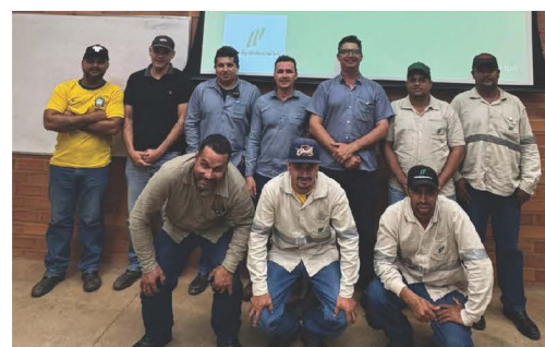
Formação da primeira turma de Caldeira, da Usina Ipê.