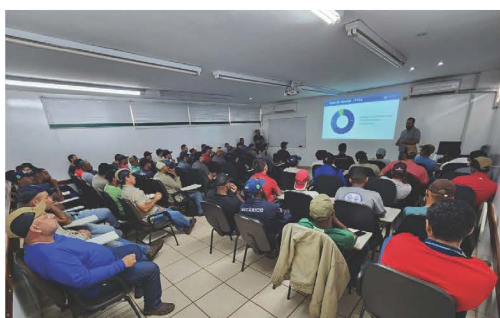
Treinamento de manutenção em filtros da MMarra e Donaldson, na Usina Buriti.