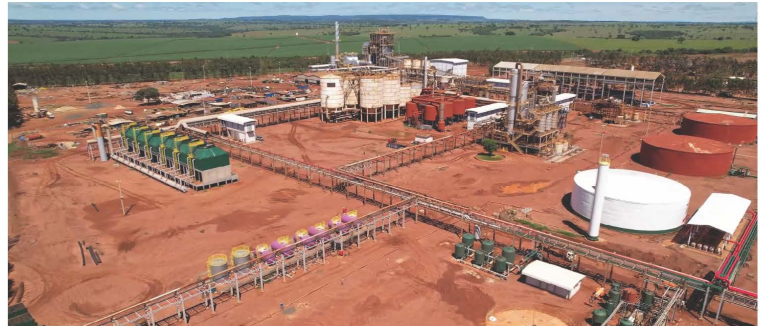
À esquerda Torres de resfriamento, Dornas de fermentação ao centro e Destilaria e à direita Tanques de água.