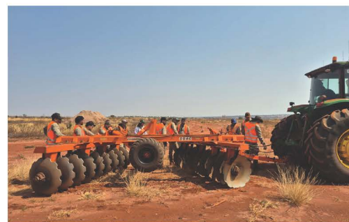
Funcionários da Usina Cedro que participaram da 5ª Escolinha de Trator.