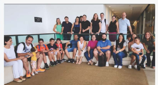
Famílias da Pedra Agroindustrial que viajaram no mês de dezembro