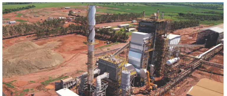
Detalhe das obras de finalização da Caldeira.