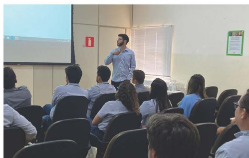
Apresentação de projetos na conclusão da Escola de Formação de Líderes, na Usina da Pedra.