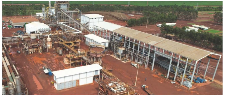
À esquerda, instalações do Tratamento de Caldo e à direita, Moenda com a Caldeira e Casa-de-força ao fundo.