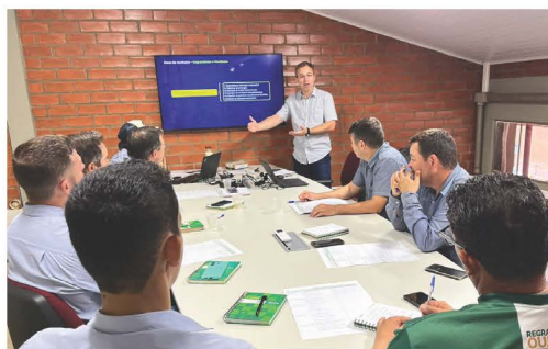
Semana da liderança da Manutenção Agrícola, na Usina Ipê.