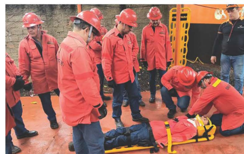
Simulação de primeiros socorros durante Treinamento de Brigadistas da Usina Buriti.