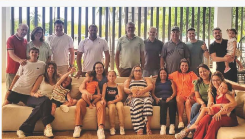
Grupo de famílias da Pedra Agroindustrial no Maceió Mar Resort.