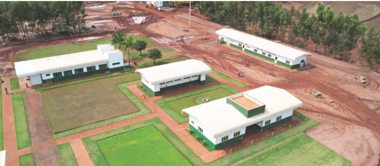
À esquerda e ao centro o Escritório Industrial, Refeitório, Serviço Social, Saúde Ocupacional, Segurança do Trabalho e à direita o Laboratório Industrial.