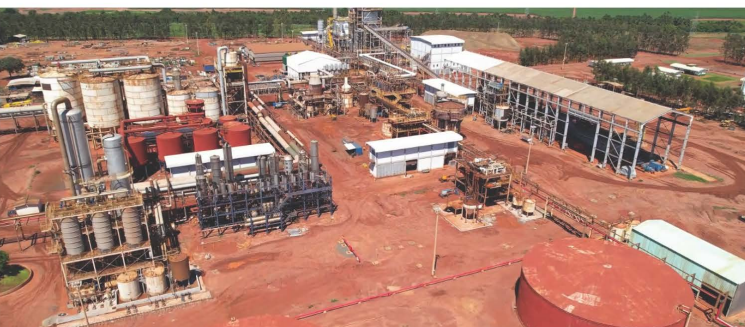
Detalhe da Destilaria e à direita a Moenda.