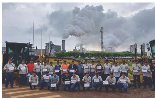
Formação da capacitação de operação com Motoniveladora, na Usina Ipê.