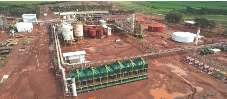
Em primeiro plano, as torres de resfriamento de água e fermentação e destilaria ao fundo.