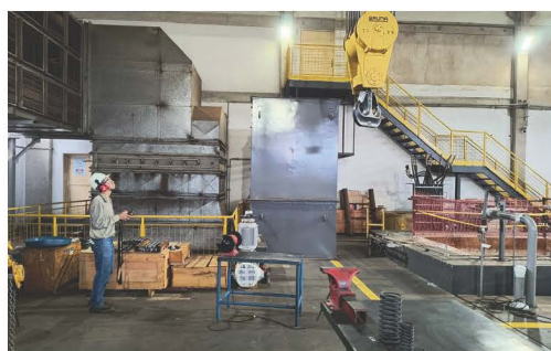
Capacitação de movimentação de carga, na Usina Buriti.